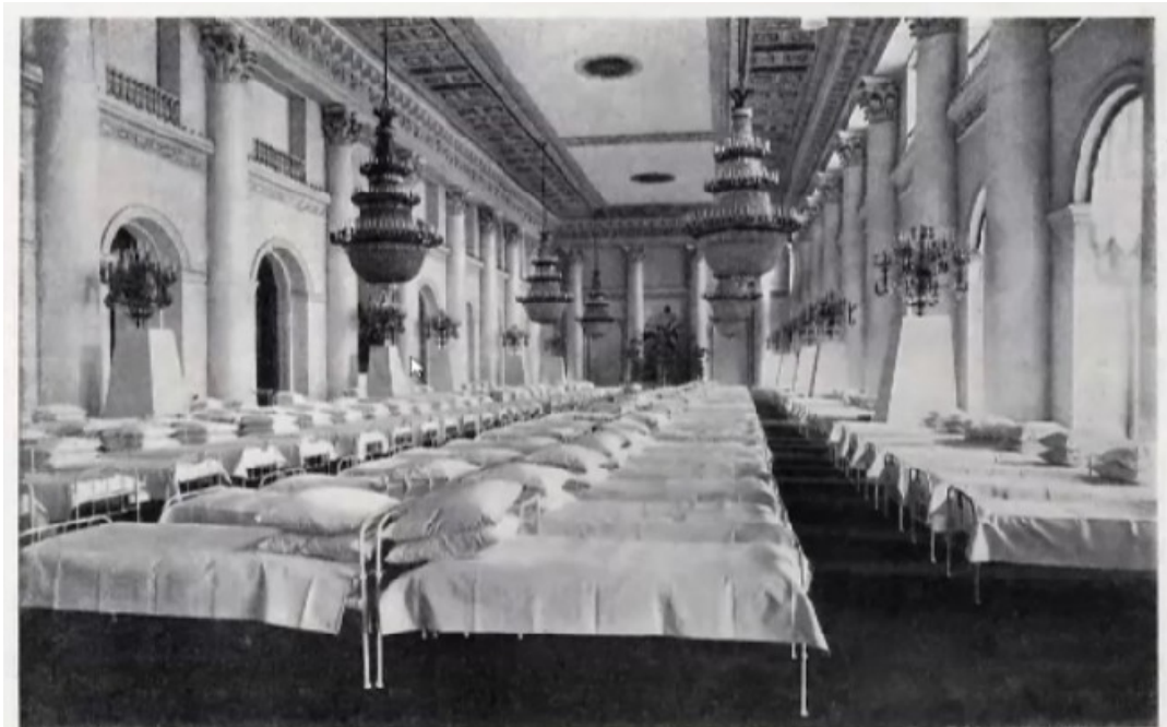
Освященный 10-го октября 1915 г. Лазарет имени Его Императорского Высочества Наследника Цесаревича и Великого Князя Алексея Николаевича в Зимнем Дворце, Николаевский зал.

Фото 2. Освященный лазарет в честь наследника Великого князя Алексея Николаевича в Николаевском зале Зимнего дворца. Петербург, 1915 год.