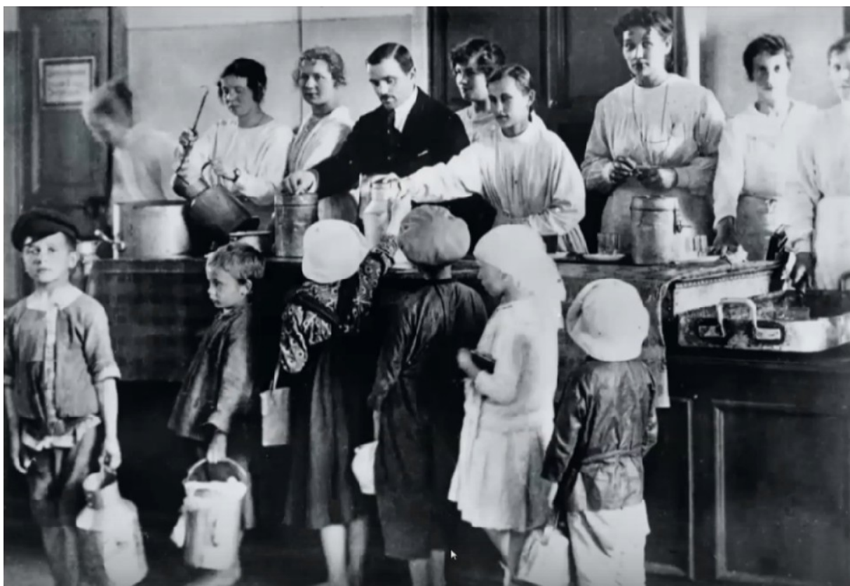
Фото 5. Благотворительность товарищества «Эйнем».

находилась в состоянии войны, беспризорников становилось все больше, никаких приютов на них не хватало. Земское собрание постановило, что нужно развивать не только закрытое, но и открытое призрение, то есть, отдавать их на попечение в обычные семьи. При этом предполагалось денежное вознаграждение для таких опекунов и контроль со стороны земства. Это был прообраз фостерных семей – патронажа в современном понимании. Фостерные семьи для беспризорников создать не успели [5]. Какое-то время поддерживалась заведенная система по передаче беспризорных городских детей в приемные крестьянские семьи и патронажу бедных и многодетных семей, но вскоре эта система была сведена на нет.