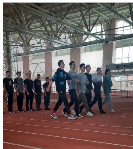
Фото 5. Манеж КГУ ФКСиТ: подготовка студентов университета к казачьему параду.

К сожалению, меньше чем за неделю студенты были оповещены о том, что в связи с обстановкой в стране в целях безопасности данный парад был отменён. Но была проделана огромная работа при подготовке, поэтому хочется выразить благодарность как студентам, так и ответственным за подготовку к параду [8].