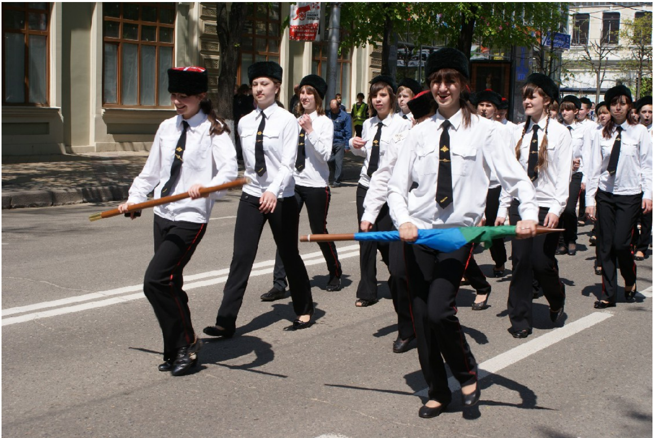
Фото 4. Казачки на параде.