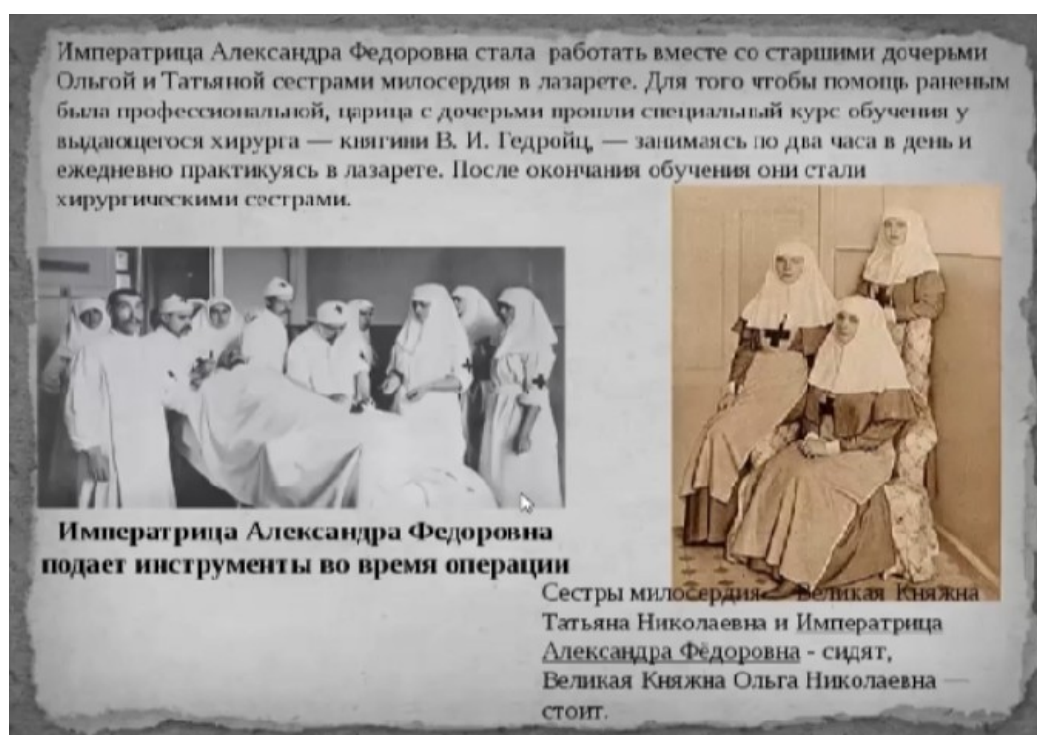
Фото 1. Императрица Александра Фёдоровна со старшими дочерьми Ольгой и Татьяной в лазарете. 1915 год.

Традиционно для России второй половины XIX в. – начала XX в. женщины императорской семьи во время военных действий профессионально работали медсестрами. Эта традиция началась с Великой княгини Елены Павловны, которая была профессиональным хирургом. После вступления России в Первую мировую войну император Николай Александрович, который взял на себя командование армией, отправился в ставку с наследником Великим князем Алексеем Николаевичем. Императрица со старшими дочерьми, Великой княжной Ольгой Николаевной и Великой княжной Татьяной Николаевной, прошли специальный курс у знаменитого хирурга княгини Гейдройц для того, чтобы работать профессионально, и трудились хирургическими сестрами (фото 1, 2).