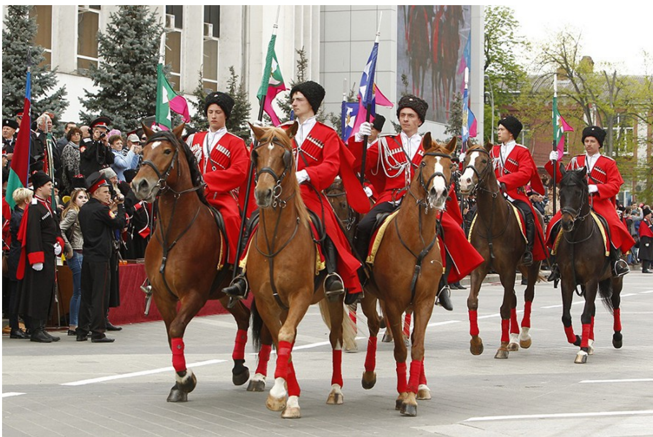
Фото 1. Едут, едут по улице Красной наши казаки...

На параде присутствуют около 10 000 казаков, в том числе более 2 000 юных казаков – учащихся классов казачьей направленности и казачьих кадетских корпусов (фото 1, 2, 3).