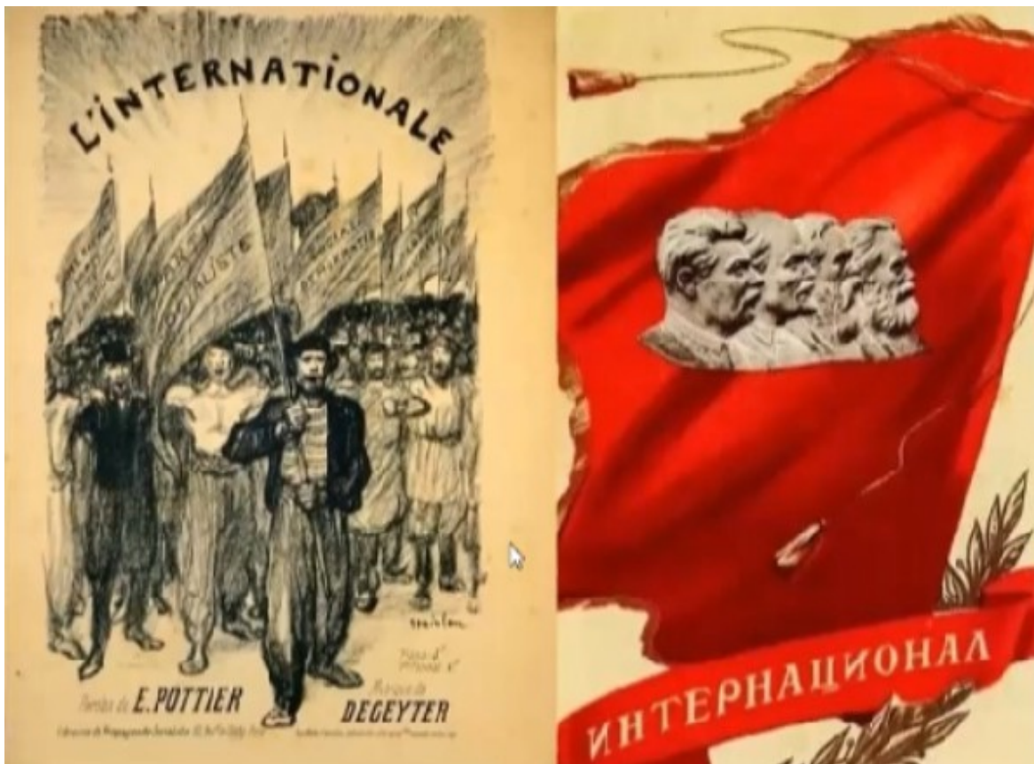
Фото 9. Единство и взаимопомощь трудящихся всех стран.

Проблемы беспризорности детей в молодой советской стране, в разгул беспризорности и преступности, решала Всероссийская чрезвычайная комиссия (ВЧК) под руководством наркома внутренних дел и путей сообщения, председателя Высшего совета народного хозяйства Ф. Э. Дзержинского.