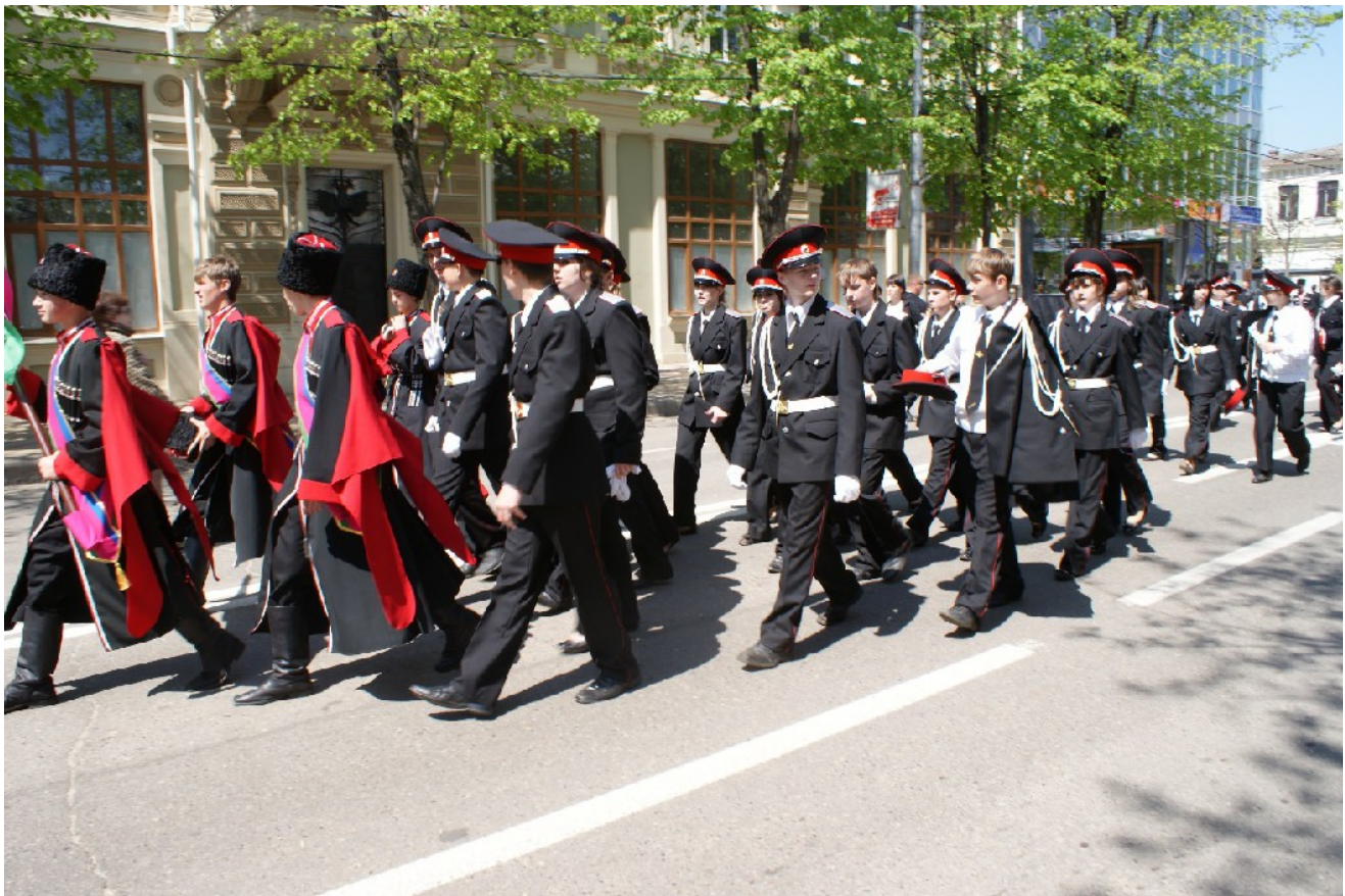
Фото 2. Кадеты на казачьем параде в г. Краснодаре.

Губернатор Краснодарского края Вениамин Иванович Кондратьев уделяет особое внимание развитию казачества в регионе. Вениамин Кондратьев уверен: роль казачества в укреплении государственности России, в патриотическом воспитании подрастающего поколения сложно переоценить. Именно поэтому Президентом Российской Федерации Владимиром Владимировичем Путиным была утверждена стратегия развития государственной политики Российской Федерации в отношении казачества.