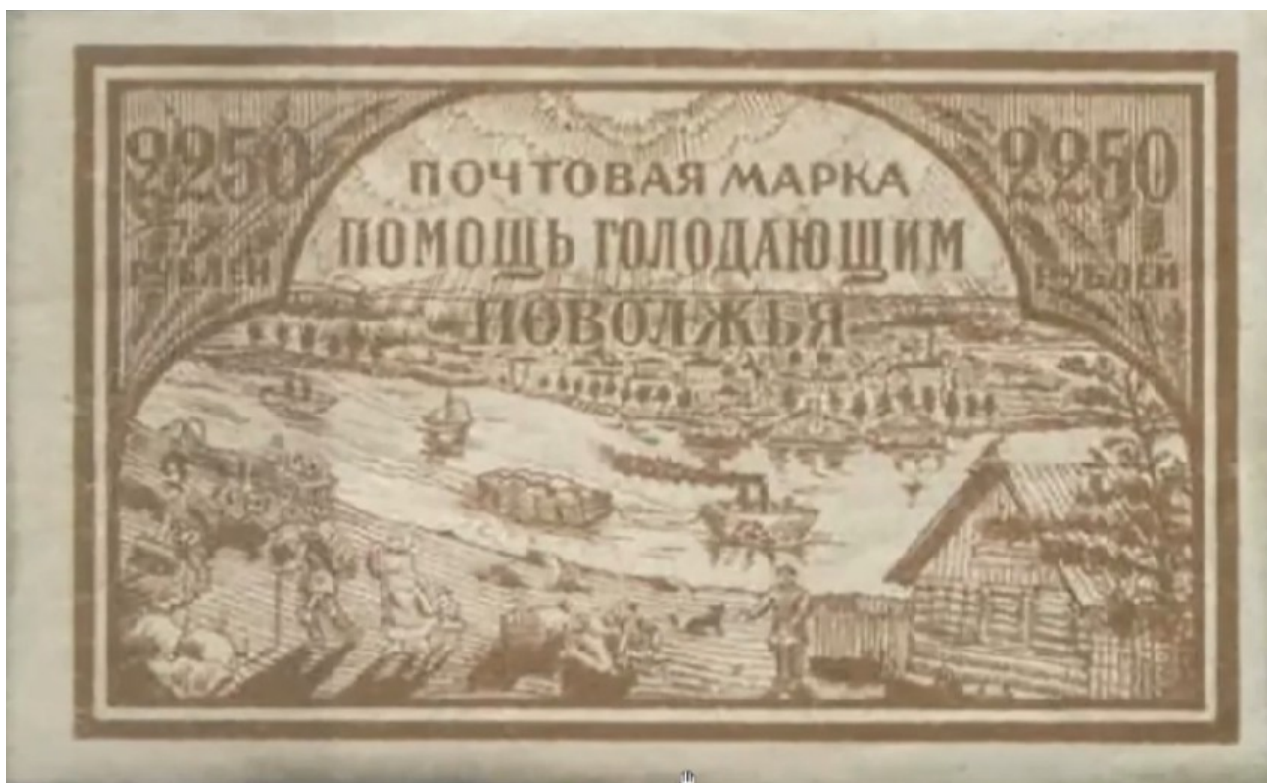
Фото 8. РСФСР, 1921 г. Марка «Помощь голодающим Поволжья».

13 июля 1921 года писатель Максим Горький обратился с воззванием «Ко всем честным людям» с просьбой помочь России продовольствием и медикаментами.