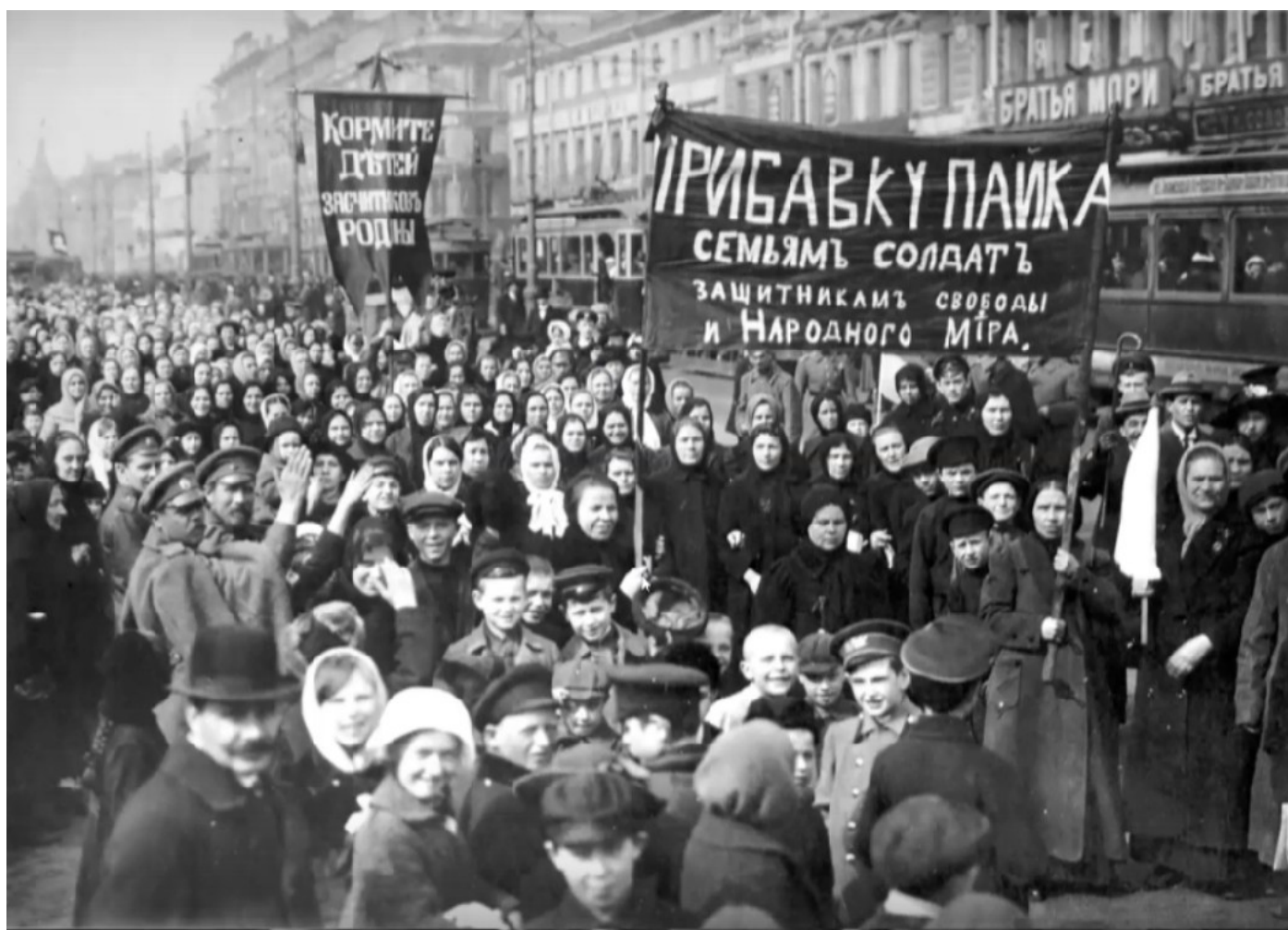
Фото 3. Демонстрация на Невском проспекте 1917 года.

После февральской революции 1917 год крупнейшие благотворительные организации оказались обезглавленными. Земства – выборные органы местного самоуправления, которые появились в России в 1864 году, – пытались сохранить помощь на местах.