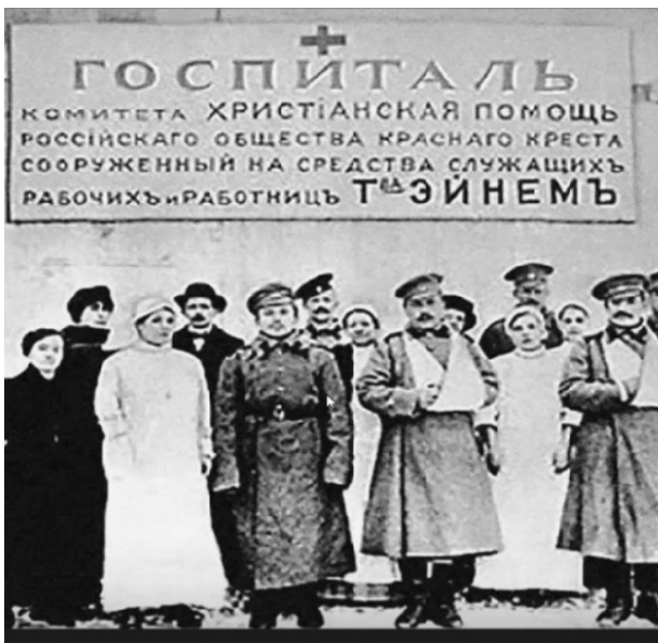
Фото 4. После февральской революции 1917 г. Товарищество «Эйнем».

обрусевший немец Теодор Фердинанд фон Эйнем. Он занимался изготовлением кондитерских продуктов, имел несколько кондитерских магазинов. После смерти Эйнема продолжатели его дела поддерживали больных и раненых военных в период Первой мировой войны (фото 3).