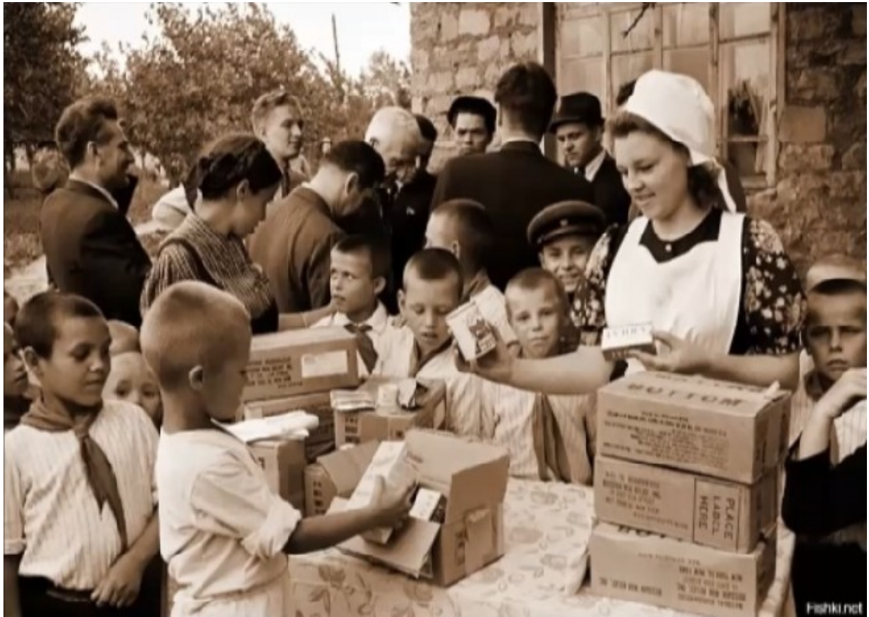
Фото 11. Продовольственные посылки из США.

Миссия Американской администрации помощи в России продолжалась до середины 1923 года, когда с голодом худо-бедно общими усилиями удалось справиться.