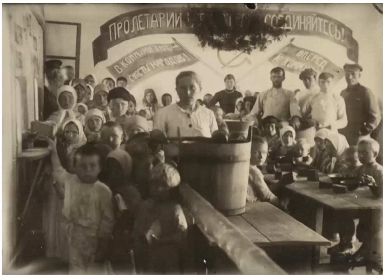
Фото 7. Голодающие Поволжья 1920-1921 гг. Комитет помощи голодающим Поволжья.

В 1921 году на территории Поволжья начался невиданный голод, охвативший 35 губерний с общим населением в 90 миллионов человек, из которых голодало не менее 40 миллионов (по официальным советским данным – 28 миллионов) (фото 7).