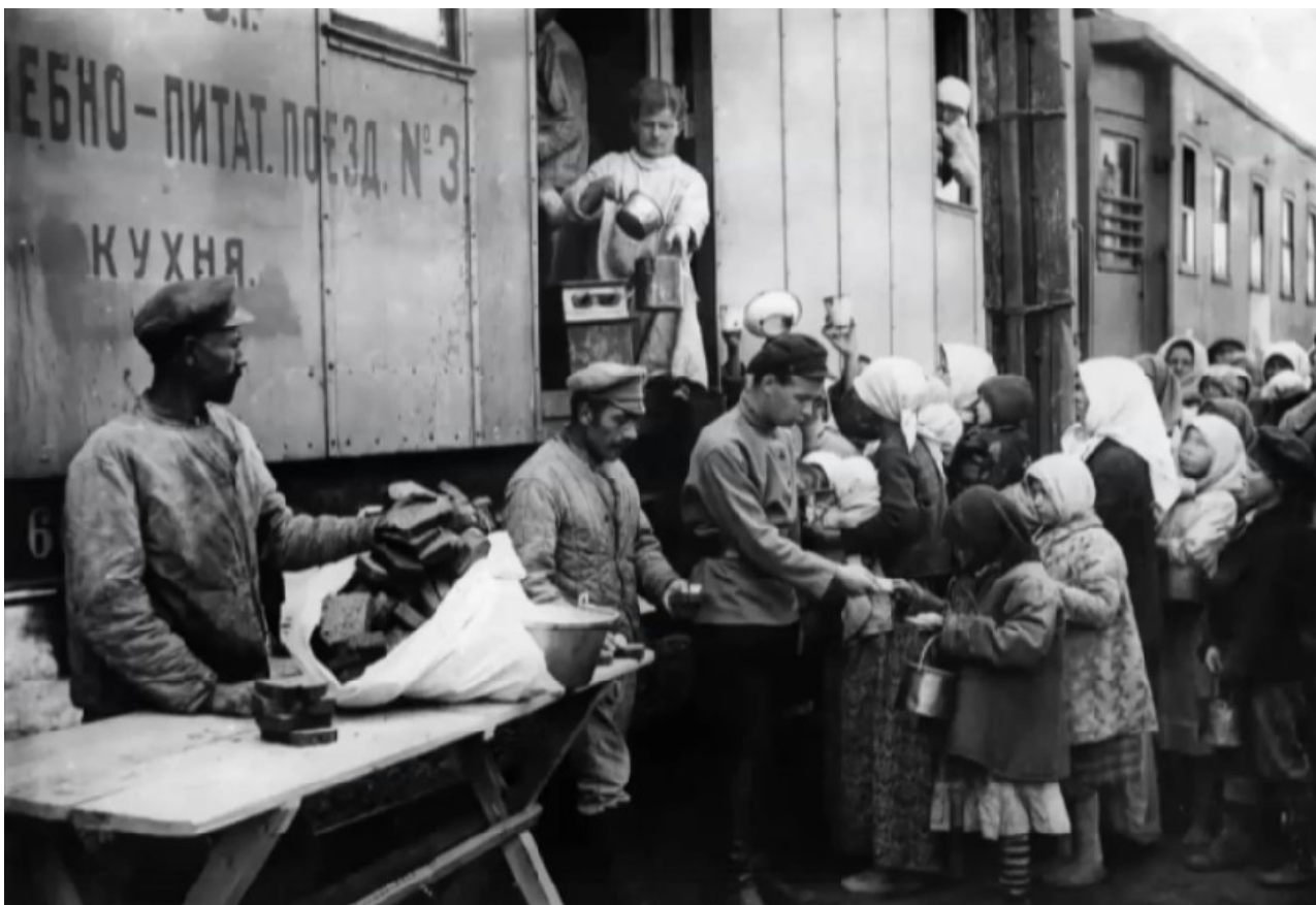
Фото 9. Продовольственный поезд Ф. Нансена в Поволжье.

«Миссия Нансена» не была ведущей благотворительной организацией, борющейся с голодом на территории России в начале 1920-х гг.