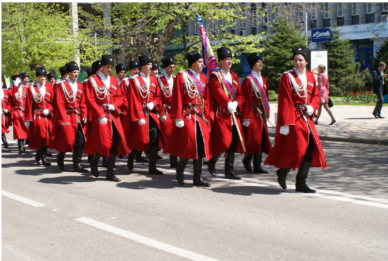
Фото 3. Казачий парад в г. Краснодаре по ул. Красной.

государственную службу кубанского казачества на принципиально новый уровень. В первую очередь, это касается деятельности казачьих дружин.