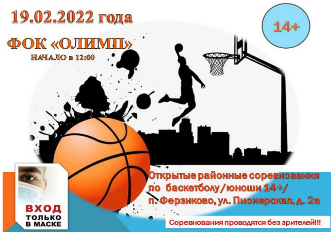
Рис 3. Афиша районного турнира «Оранжевый мяч».

Бренд «Оранжевый мяч» – стильный и красивый. Очень нравится молодежи. Необходимо всё больше популяризировать турнир через выпуск сувенирной продукции с мячом: брелоки, флешки, скрепки, блокноты, плакаты, салфетки, полотенца, спортивные сумочки [7].