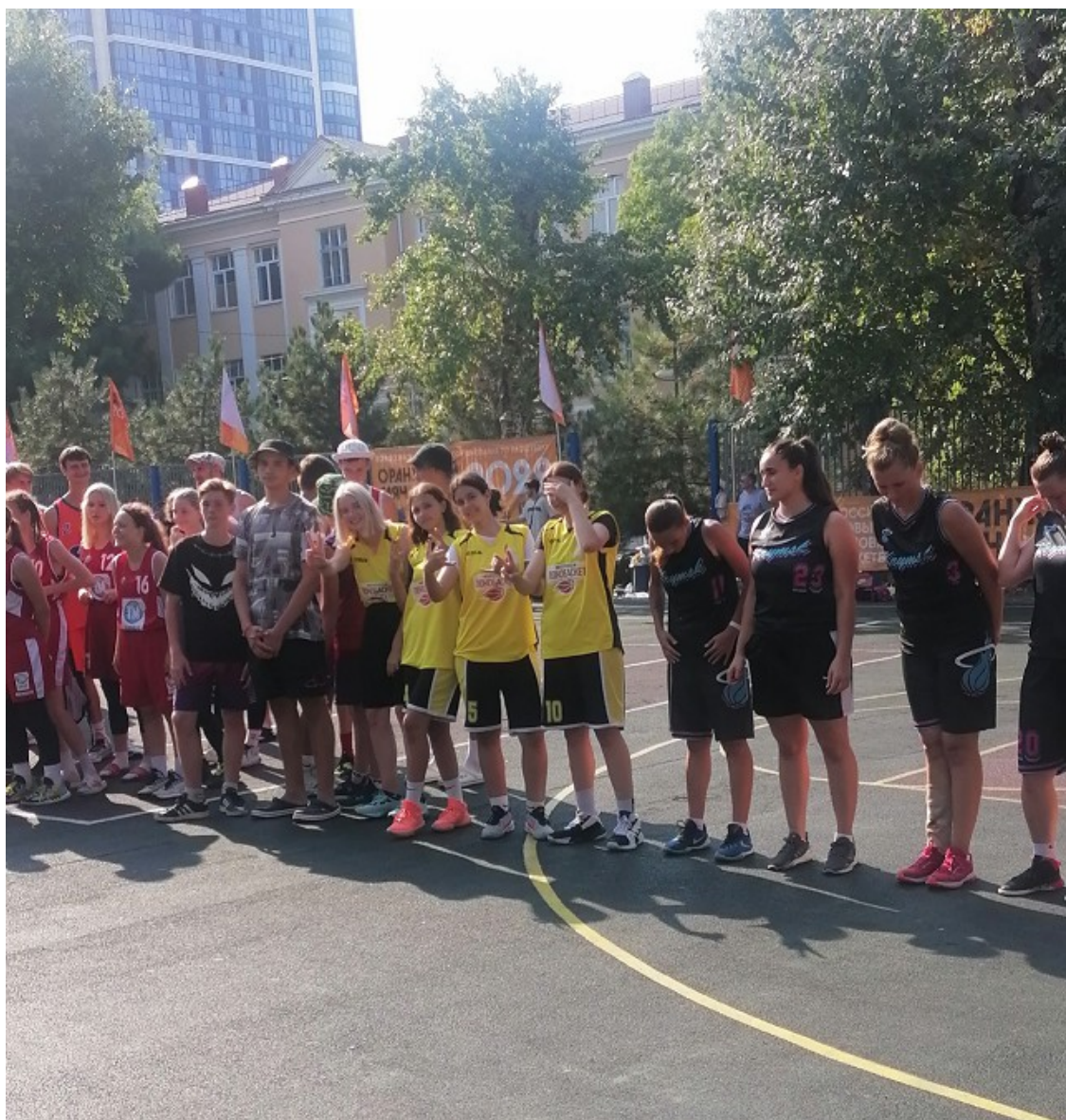
Фото 2. Играть в уличный баскетбол – это здорово.

Игра проводится на баскетбольной площадке 3х3 с одной корзиной. Стандартная игровая площадка 3х3 имеет размеры 15 м (ширина) x 11 м (длина).