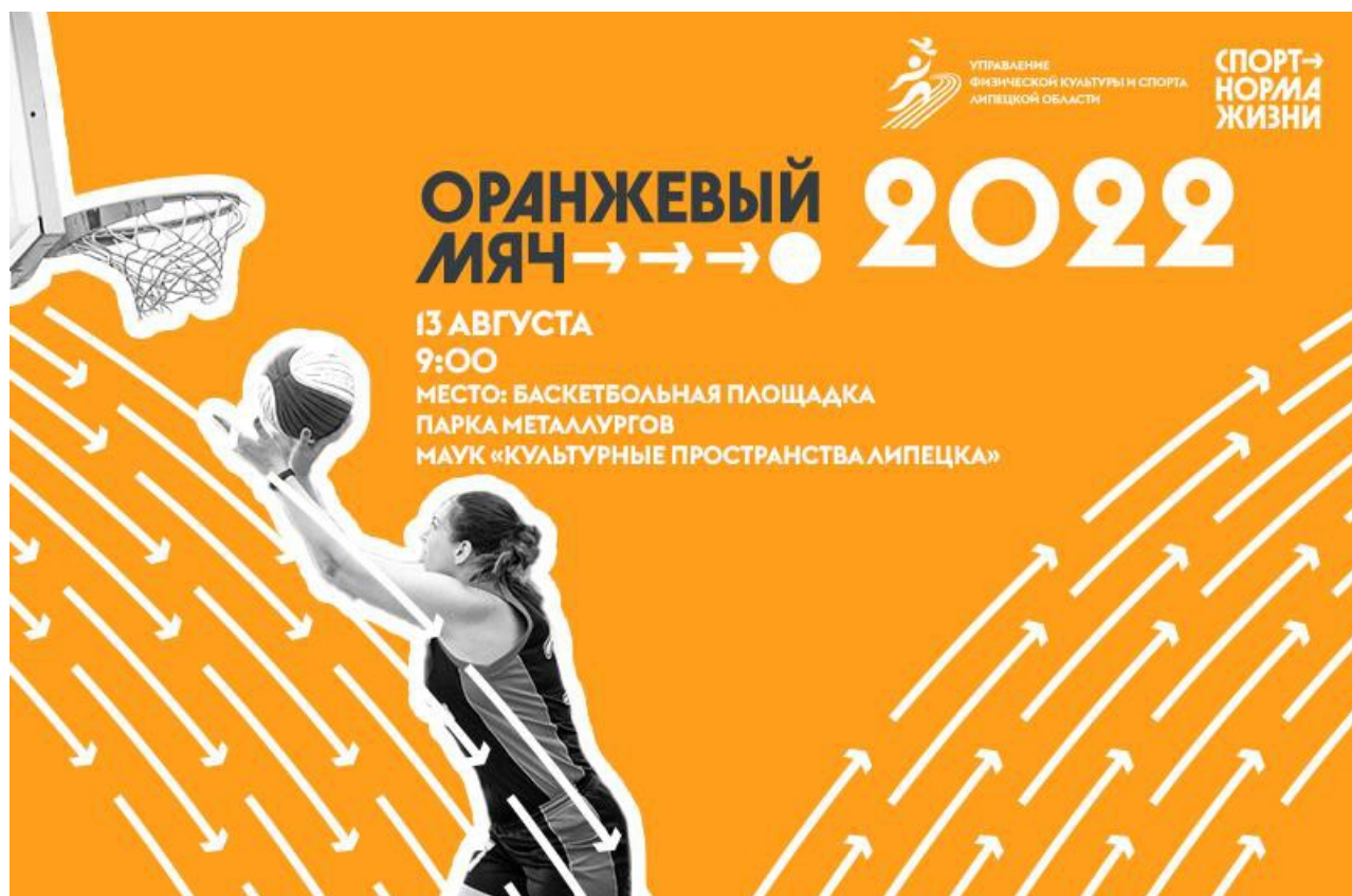
Рис 2. Афиша спортивного мероприятия.

В 2022 году турнир побил все рекорды по количеству участвующих команд: побороться за победу сразу в десяти категориях в прошлом году собрались 113 коллективов. Для сравнения: в «Оранжевом мяче» 2021 года приняли участие 60 команд. Еще 45 игроков сыграли в турнире 1x1, шесть команд из трёх детских домов сыграли в рамках проекта «Тихий баскетбол», а еще 8 команд приняли участие в «Спартакиаде» ветеранов [8].