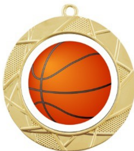
Рис. 6. Медаль победителям турнира «Оранжевый мяч» 2022 г.