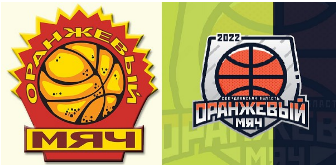
Рис. 4. Стикеры «Оранжевого мяча».