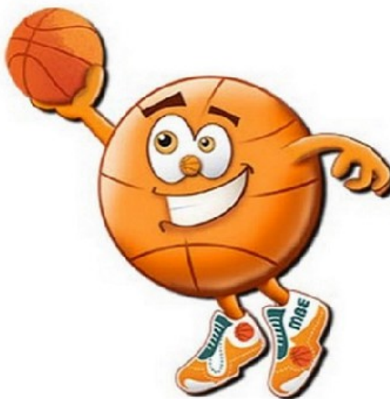
Рис.1. Эмблема всероссийского турнира по баскетболу 3x3 «Оранжевый мяч».

Всероссийский турнир по баскетболу 3x3 «Оранжевый мяч» идет по всем регионам России [5, 6].