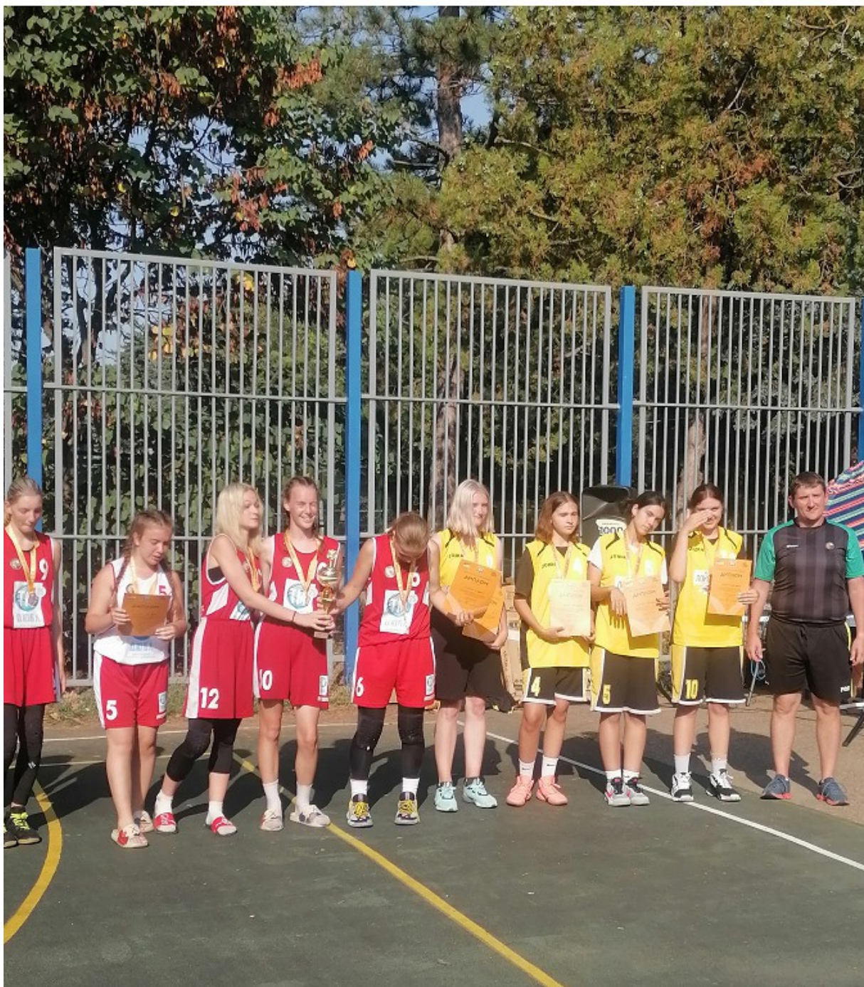
Фото 4. Поздравление победителей турнира «Оранжевый мяч» 2022 г. – команду из города Анапа.