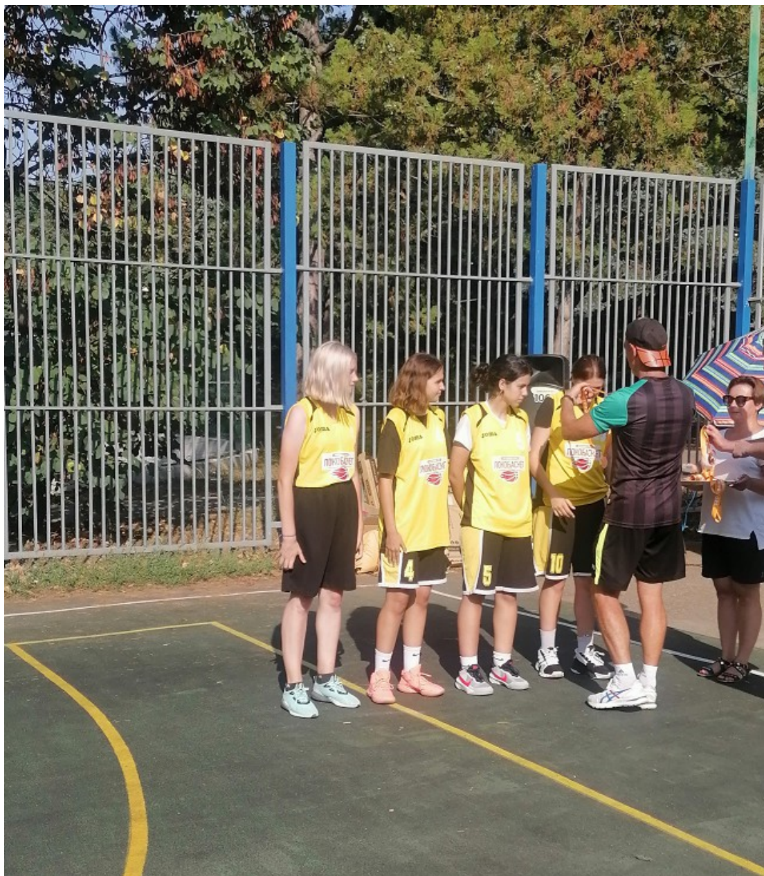
Фото 5. Солнечные здоровые дети играют в баскетбол.

Школьный клуб «Виктория» г. Сочи в 2022 году занял третье место в турнире «Оранжевый мяч», пропустив вперед хозяев команды из города Анапы.