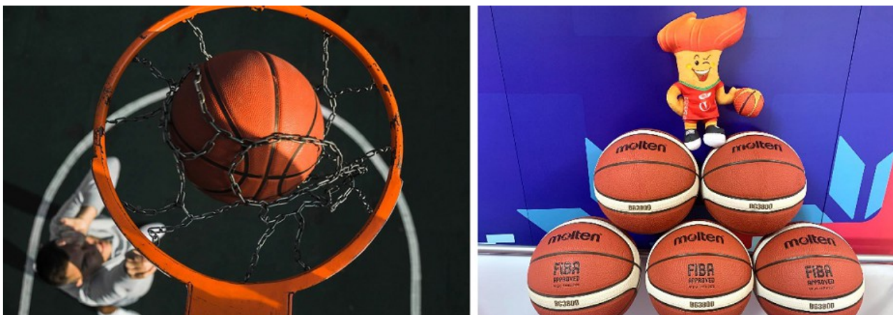
Фото 1. Плакаты «Оранжевого мяча» – хорошая реклама турнира.