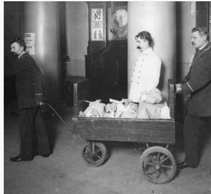
Перевоз монет в кладовую

В 1797 году подписан указ об учреждении Монетного двора Ассигнационного банка. Монетный двор представлял собой достаточно технологически сложное сооружение. Здесь были золотые, серебряные и медные плавильни, плащильни, обрезающие, печатные, кузница с цилиндрическими мехами и токарным станком, паровые котлы. На Монетном дворе находилась «огненная машина», которая с силой 16 лошадей приводила в движение четыре вала, доводившие серебряные слитки пробы 831/3 до нужной толщины.