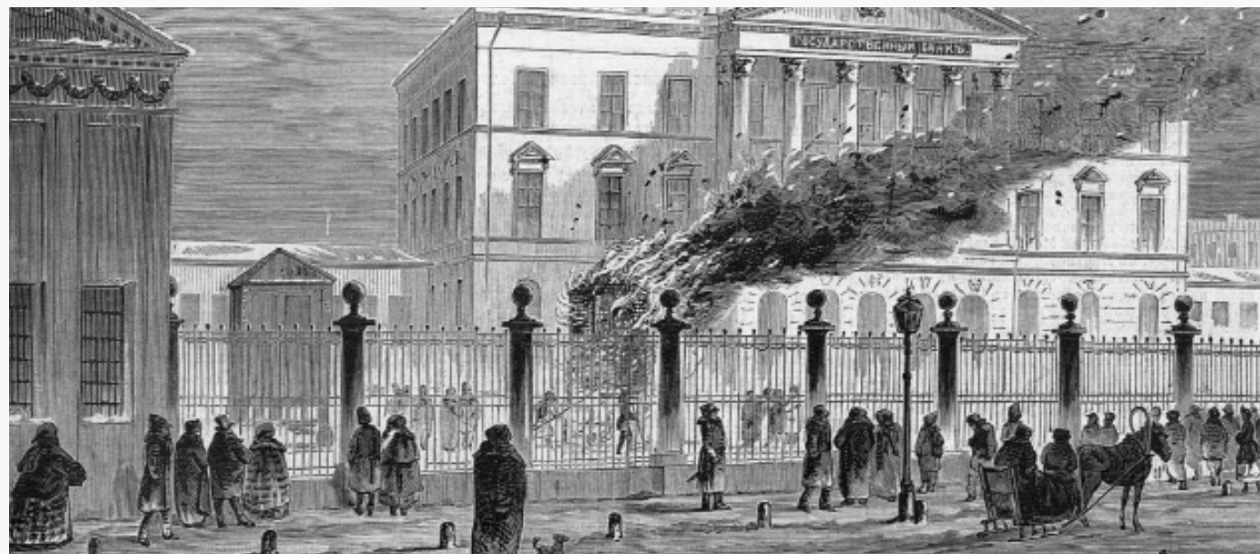
Печь для сжигания кредитных билетов и фасад банка (1860-е годы)