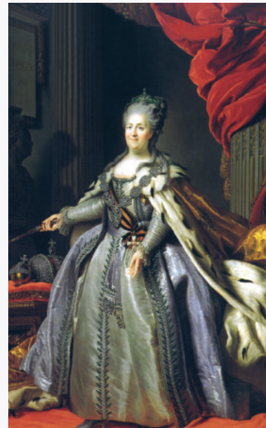
Екатерина II (1729 — 1796)

В период царствования Екатерины II (1762 — 1796) наблюдалось значительное напряжение финансовой системы, поскольку государству приходилось постоянно покрывать растущие военные расходы, связанные с многочисленными военными кампаниями второй половины XVIII в. Вся банковская политика этого периода была подчинена задаче поиска всевозможных средств для пополнения казны. Именно с этой целью были учреждены ассигнационные банки в Петербурге и Москве. Они должны были заменить металлические деньги на бумажные, которые были бы более удобными в обращении. При этом ассигнации обращались наравне со звонкой монетой. При осуществлении различных