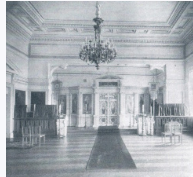
Церковь Св. Александра Невского

В 1797 году подписан указ об учреждении Монетного двора Ассигнационного банка. Монетный двор представлял собой достаточно технологически сложное сооружение. Здесь были золотые, серебряные и медные плавильни, плащильни, обрезающие, печатные, кузница с цилиндрическими мехами и токарным станком, паровые котлы. На Монетном дворе находилась «огненная машина», которая с силой 16 лошадей приводила в движение четыре вала, доводившие серебряные слитки пробы 831/3 до нужной толщины.