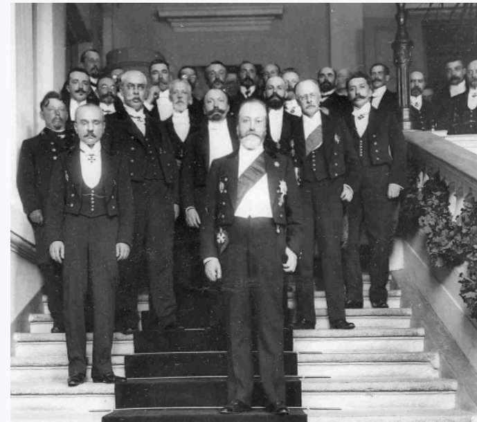
Гости 50-летнего юбилея Государственного банка

В период царствования Екатерины II (1762 — 1796) наблюдалось значительное напряжение финансовой системы, поскольку государству приходилось постоянно покрывать растущие военные расходы, связанные с многочисленными военными кампаниями второй половины XVIII в. Вся банковская политика этого периода была подчинена задаче поиска всевозможных средств для пополнения казны. Именно с этой целью были учреждены ассигнационные банки в Петербурге и Москве. Они должны были заменить металлические деньги на бумажные, которые были бы более удобными в обращении. При этом ассигнации обращались наравне со звонкой монетой. При осуществлении различных