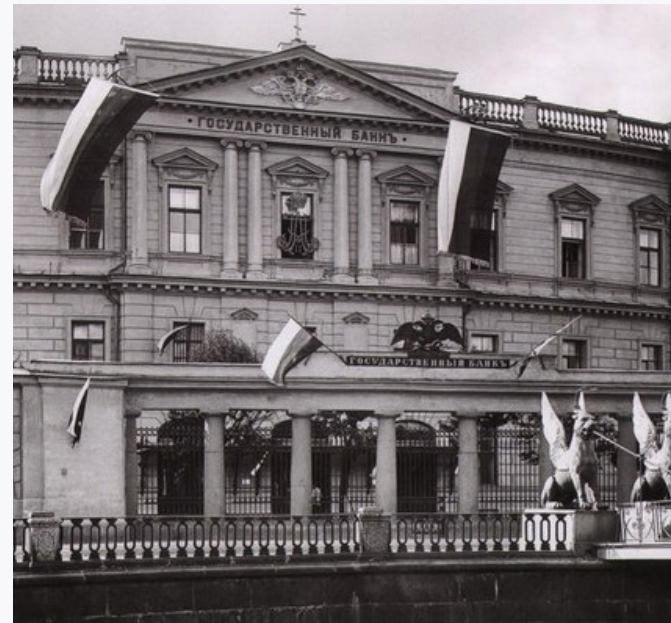
Государственный банк (около 1910 года)

К строительству был привлечен молодой итальянец-архитектор Джакомо Кваренги. Главный корпус банка был задуман архитек-