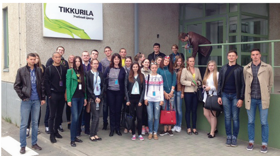
Учебная практика в форме экскурсии оказалась полезна как студентам, так и представителям бизнеса.

«Экскурсия на предприятие «Ниссан» была весьма впечатляющей. Специалисты увлекательно и доступно рассказали об истории компании, ее организационной структуре, особенностях производства и осуществлении логистических процессов. Мы побывали на всех участках производства, в отделах внутренней и внешней логистики завода. Теперь мы представляем, как должна быть организована логистика на успешном предприятии. Понравилось