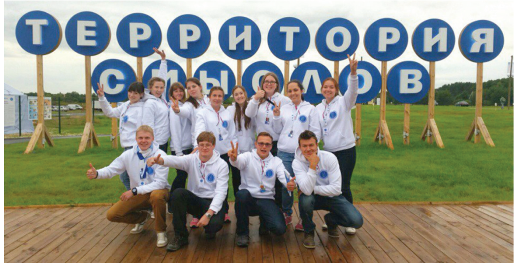
Члены Совета молодых ученых привезли с форума свежие идеи, полезные знания и заряд вдохновения для новых начинаний в наступившем учебном году.

В середине августа наиболее активные представители Совета молодых ученых приняли участие в главном молодежном образовательном форуме страны — «Территория смыслов на Клязьме», смена «Молодые ученые и преподаватели экономических наук». В течение недели девять представителей молодежной науки нашего вуза были вовлечены во все мероприятия