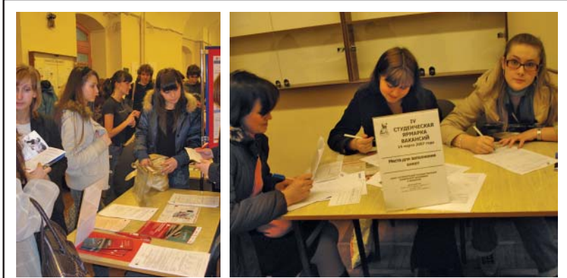
общеуниверситетская ярмарка вакансий

Наш адрес: мансарда 4 комната, часы работы с 10.00 до 18.00 телефон 310-40-78; http://rabota.fines.ru ; e-mail: job@fines.ru