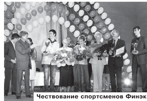
Чествование спортсменов Финэка

18 мая в спортивном комплексе (Ап-раксин пер., 13) состоялся пятый ежегодный фестиваль спорта «Бал чемпионов». На мероприятии были подведены спортивные итоги года. Были награждены победители внутривузовских соревнований и спартакиады университета. В этом году впервые за дол-