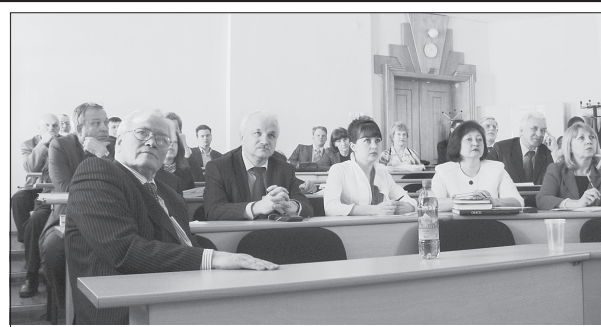
В честь юбилея кафедры была проведена научная конференция, в которой приняли участие известные представители в сфере коммерции и логистики

та после пяти лет обучения. Новая система образования будет работать по следующей схеме: первый уровень – бакалавриат (четыре года), второй – магистратура (два года). Для того, чтобы наименее болезненно перейти на новую систему образования, многое уже сделано: на сегодняшний день мы можем говорить о резком расширении магистерской подготовки студентов. У нас открыты три магистерских программы: «Коммерция на рынке товаров и услуг», «Международная торговля» и «Логистика». В настоящее время кафедра готовит студентов по двум специальностям «Коммерция» и «Логистика» и ведет обучение более чем по 50 учебным дисциплинам. Еще одна сложная задача, которая стоит перед кафедрой – это изменения в регламенте отбора студентов. Со следующего года на специальность «Коммерция» студентов будут набирать не после второго года, как это делалось до сих пор, а сразу при поступлении в университет. Пока непонятно, как это может отразиться на общем уровне подготовленности и мотивированности студентов, ведь