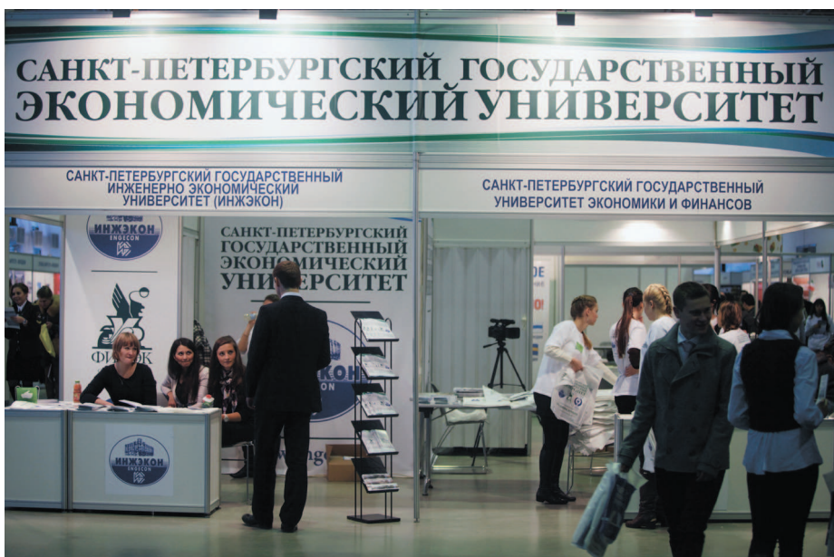
На международной выставке «Образование и карьера-2012» в Ленэкспо Финэк, Инжэкон и ГУСЭ были представлены на единой площадке под брендом нового Санкт-Петербургского экономического университета.