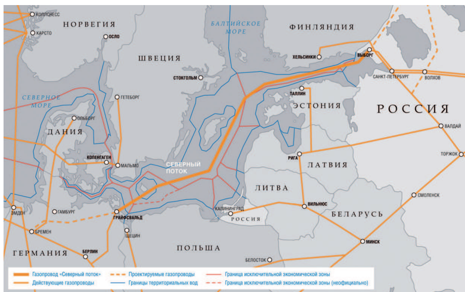
Проект «Северный поток». http://www.gazprom.ru

Я думаю, что это временные трудности. Из кризиса мы рано или поздно выйдем, а