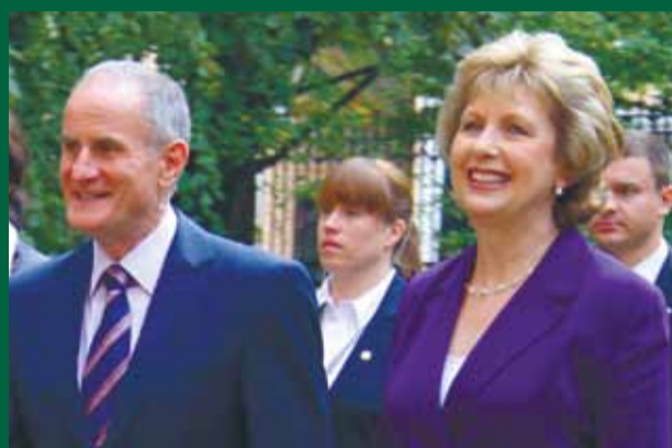
Визит президента Ирландии госпожи Мэри Макэлис