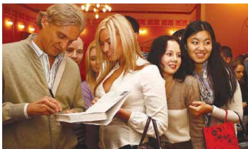
Для студентов ФИНАКа предприниматель Олег Тиньков — звезда первой величины

маться чем-то новым — одна из черт характера бизнесмена. Если появляется новая идея, он ее обязательно реализует. Так, Тиньков попал в финансовый бизнес, а в 2006 году открыл банк «Тинькофф». Кредитные системы». Компания продолжает расти, сегодня она обслуживает 800 тысяч карт. Олег Тиньков с гордо-