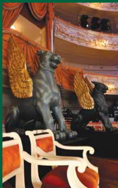
Торжественный вечер в Михайловском театре, посвященный 80-летию СПбГУЭФ