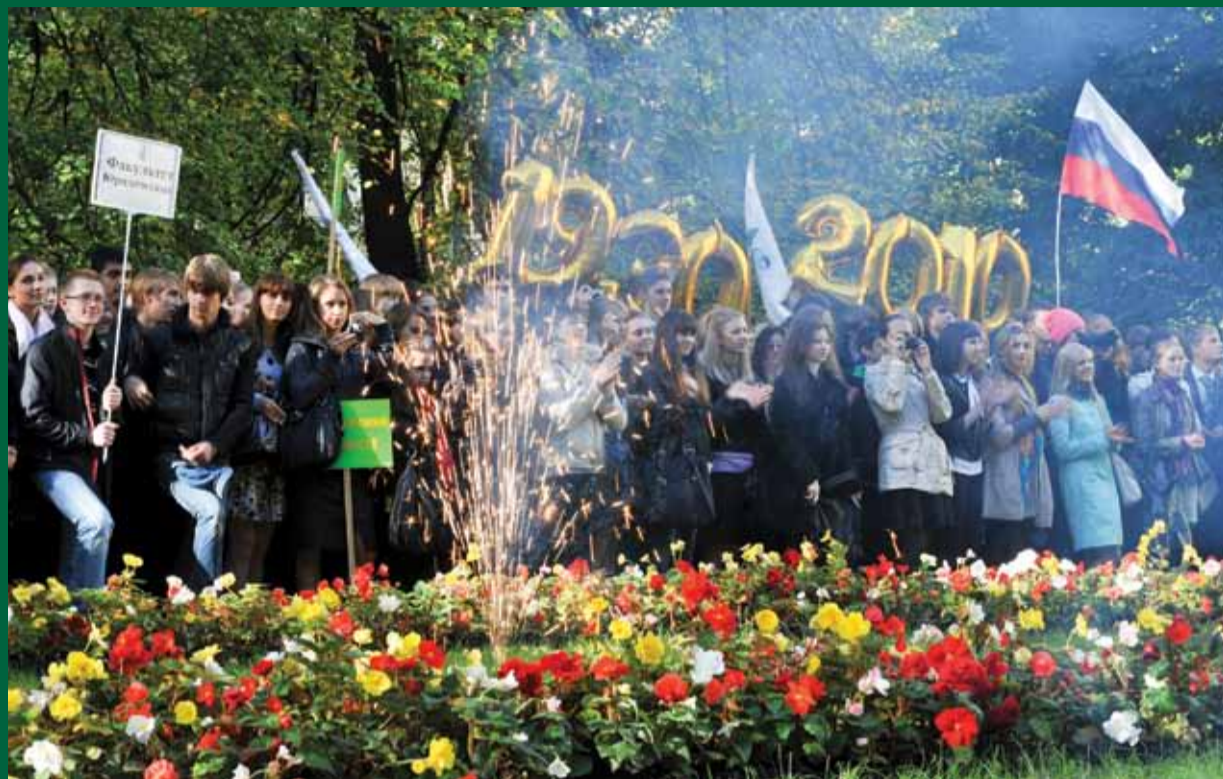
Праздник торжественного посвящения первокурсников в студенты в сквере ФИНЭКа на Садовой улице