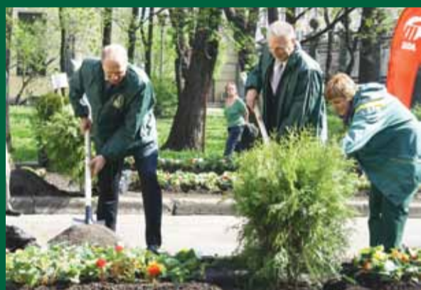
Акция «Посади дерево» в сквере ФИНЭКа на Садовой улице