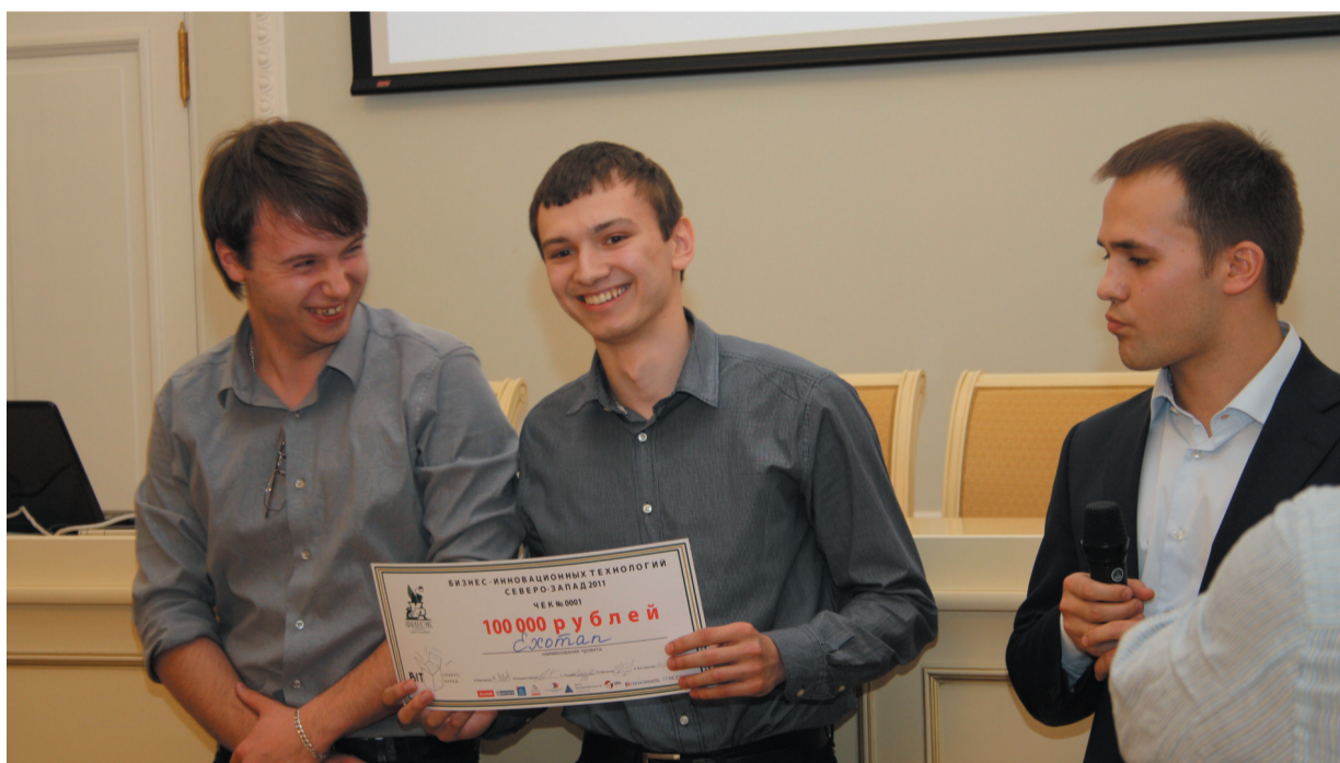
Главный приз, чек на 100 тыс. рублей, присудили команде, разработавшей экзоскелет.

29 апреля 2011 года в нашем университете состоялся финал регионально-го этапа конкурса «Бизнес Инновационных Технологий — Северо-Запад 2011». Предпринимательский Конкурс «БИТ» проводится в России уже в восьмой раз. Название конкурса отлично отражает его практическую направленность — это соревнование команд, способных не только разработать инновационную идею, но и превратить ее в успешный бизнес.