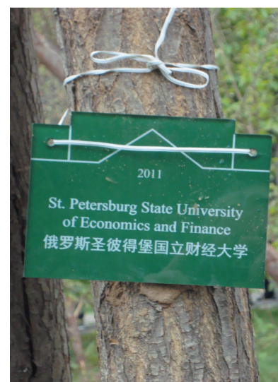
Дерево имени Финэка теперь растет в Центральном парке вуза-юбилера.