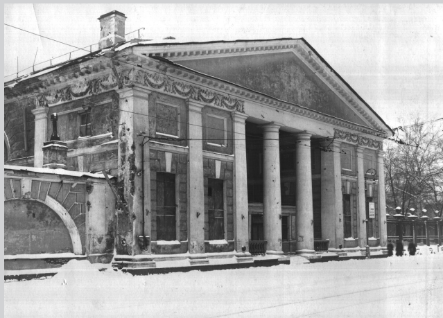
Здание университета в годы войны: полуразрушено и не отапливается.

■ ■ ■ 22 июня 1941 года началась Великая Отечественная война. Уже на следующий день добровольцы обоих вузов, преподаватели, служащие и студенты Ленинградского финансово-экономического и Ленинградского инженерно-экономического институтов стали записываться на фронт.