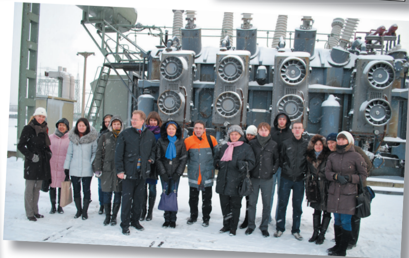
Чтобы сфотографироваться на фоне советского генератора в 50 Hertz, магистрантам Финэка нужно было оказаться в Германии.

«Прошлый год для 15 студентов и магистрантов завершился великолепным подарком от Финэка: двухнедельной учебной стажировкой в университете Карло Каттанео (Carlo Cattaneo) в Милане (Италия). Уже на следующий после приезда день началось обучение, программа была очень интенсивной. В рамках нашей стажировки за небольшое время мы успели побывать на разнообразных лекциях, познакомиться с различными методиками преподавания не только итальянских, но и швейцарских преподавателей, изучить глобальный информационный библиотечный центр и посетить крупные фирмы и предприятия энергетического сектора, такие как Tatini Group, Pensotti FCL, Colombo. Лекции были специально адаптированы для нашей группы. Нам охотно рассказывали о деятельности различных компаний, подготавливали ряд презентаций и раздаточных материалов, отвечали на самые разнообразные вопросы и даже показали процесс производства».