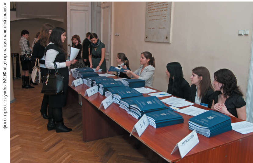
Студенты Финэка приняли активное участие в проведении форума

8 апреля в Санкт-Петербурге прошла четвертая сессия Общественно-педагогического форума «Просвещение в России: традиции и вызовы нового времени», организованного Межрегиональным Общественным Фондом «Центр Национальной Славы», Санкт-Петербургским государственным университетом и Российским государственным педагогическим университетом им. А.И. Герцена.