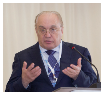
Ректор Московского государственного университета им. М.В. Ломоносова Виктор Садовничий

То же касается нострификации: мы должны безоговорочно дать возможность молодым людям устраиваться в наших странах, и дипломы должны быть признаваемы. Кстати, в ближайшее время в России мы пере-