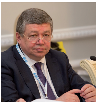
Директор Института экономики РАН Руслан Гринберг

Экономическую секцию форума «Единое экономическое пространство: возможности развития эффективного бизнеса без границ» с участием представителей Евразийского Банка Развития, крупного бизнеса и видных ученых провел ректор СПбГЭУ Игорь Максимцев. На этом круглом столе говорили об инвестиционных возможностях для производителей и инвесторов в ЕЭП, о формировании общего рынка труда и развитии транспортных коридоров в странах ЕЭП, а также других важных вопросах, посвященных экономической интеграции. Со-модератором секции выступил директор Института экономики РАН Руслан Гринберг :