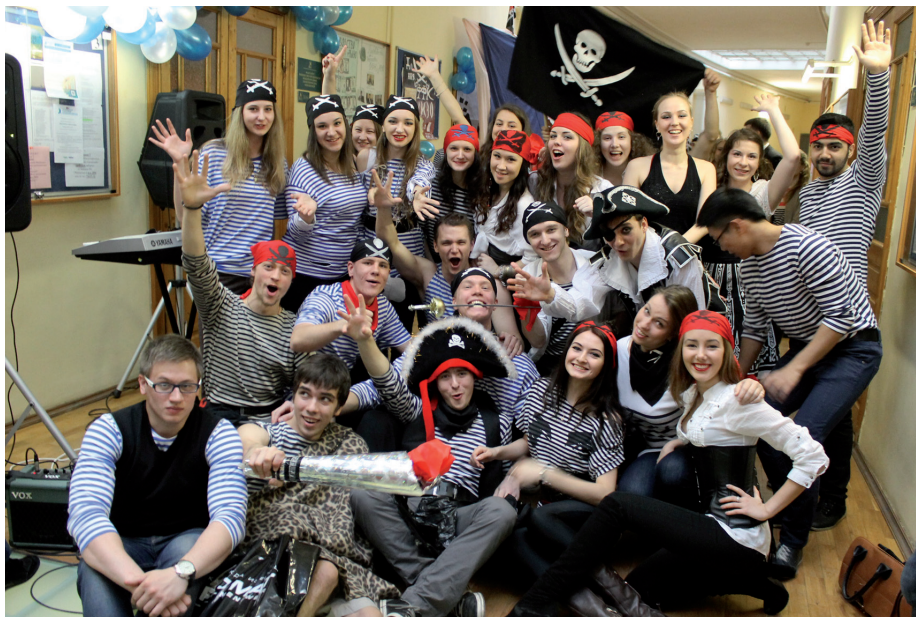
Пиратская флотилия с факультета финансово-кредитных и международных экономических отношений

Студенты 1, 2 и 3 курсов активно записывались добровольцами в команду к финансовым пиратам: рядом с каждой из шести кафедр можно было узнать о самой кафедре, пройти интеллектуальный конкурс и стать настоящим «морским волком». Также в перерывах между парами молодые юнги и бывалые моряки были не прочь потанцевать