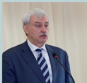
ГЕОРГИЙ ПОЛТАВЧЕНКО, ГУБЕРНАТОР САНКТ-ПЕТЕРБУРГА:

Я хочу отметить, что Санкт-Петербург много сегодня делает для укрепления кооперационных связей, расширения границ Единого экономического пространства. В нашем арсенале мощный производственный, научный, кадровый, инновационный потенциал, которым обладает город.