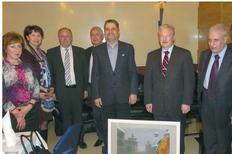
Премьер-министр Армении Тигран Саркисян и ректор СПбГУЭФ Игорь Максимцев (слева и справа от картины).

На рабочих встречах с коллегами из АГЭУ (бывший Ереванский институт народного хозяйства) обсуждалась тема восстановления сотрудничества, начатого в 1980-е годы. Армянские коллеги с теплотой вспоминают студенческие дни, проведенные в стенах нашего университета, а также незабываемые каникулы на базе «Змеиная горка».