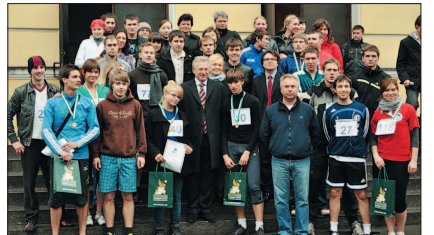
Студенты факультета РИТММ