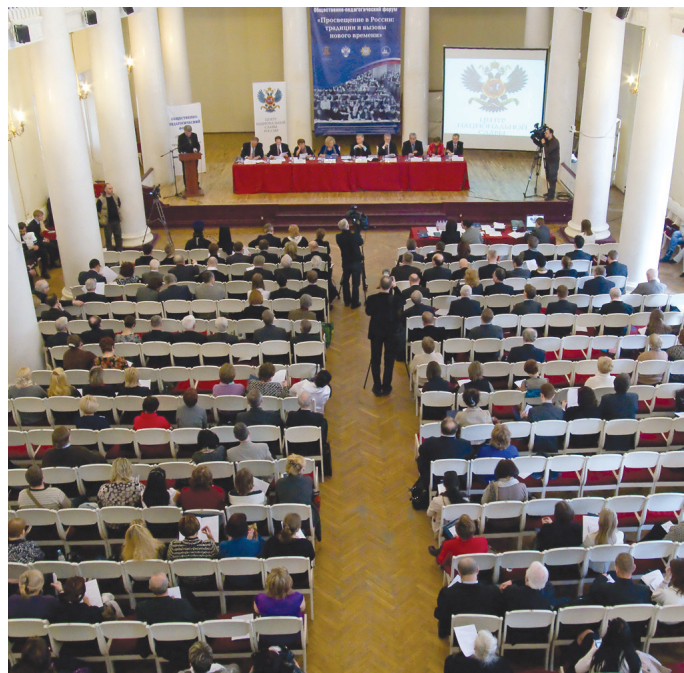
Пленарное заседание состоялось в Актовом зале СПбГУ. Волонтерскую поддержку организаторам мероприятия традиционно было доверено оказывать только студентам Финэка.

Доклад президента ОАО «РЖД» Владимира Якунина стал ключевым выступлением пленарного заседания. В своей речи он проанализировал ситуацию, сложившуюся на сегодняшний день в сфере духовного и культурного воспитания в нашей стране. Не обошел он своим вниманием и самые резонансные темы последнего времени: осквернение христианских святынь и храмов, скандальные ситуации, в которые оказались втянуты православная церковь и лично патриарх Ки-