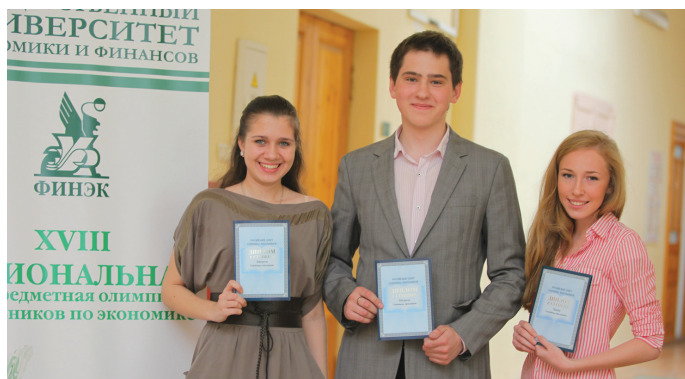
Счастливые победители школьной олимпиады и, возможно, будущие студенты СПбГУЭФ.