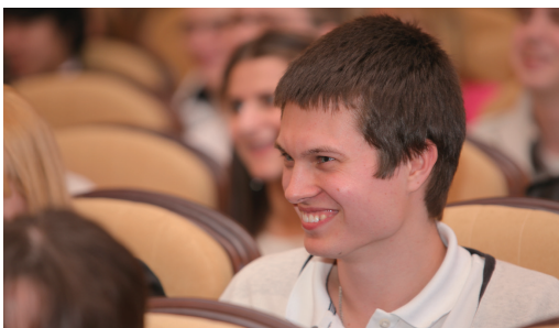
После официальной церемонии передачи таблички нового фан-клуба «Зенита» Вячеслав Малафеев стойко выдержал и серию вопросов от студентов, и атаку поклонников с фотоаппаратами и ручками.