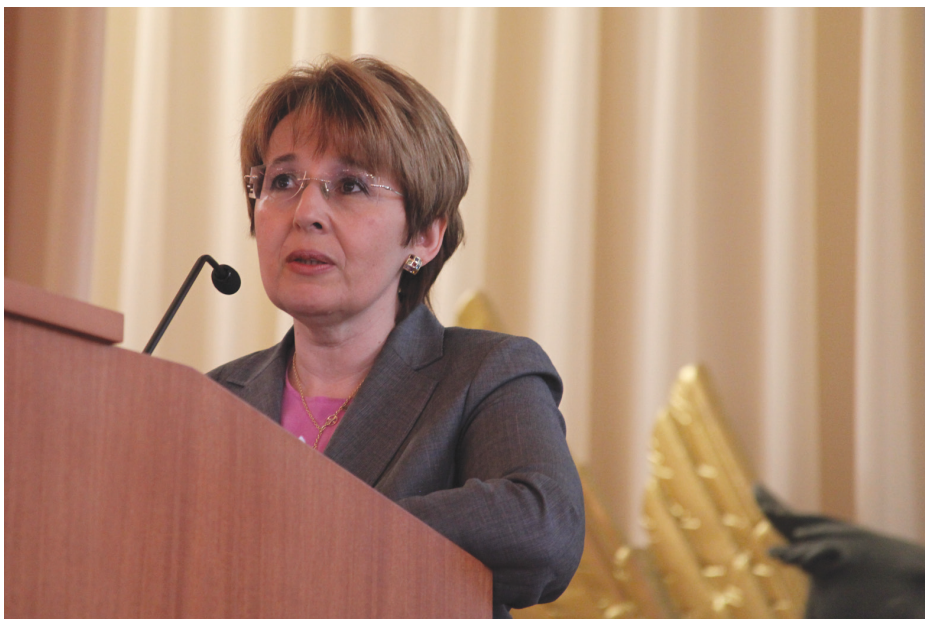
Депутат Государственной Думы РФ Оксана Дмитриева поделилась с магистрами Финэка своим видением инновационных преобразований в стране.

Выпускница Финэка, депутат Госдумы и профессор СПбГУЭФ Оксана Дмитриева вы-