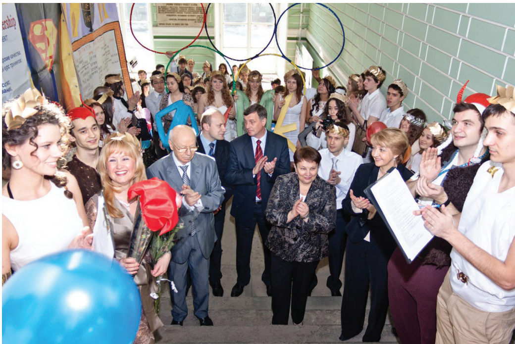
Олимпионики-финансисты приветствуют рекордсменов экономической науки: руководителей вуза.

«Команде Олимпийских рекордсменов физкульт-привет!!!». В тематике Олимпийских игр прошел День ФФК и МЭО, отмечающийся 5 апреля.