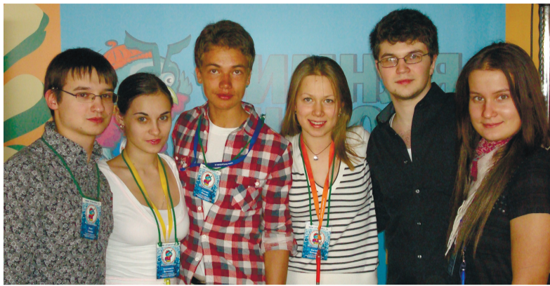
Студенты Финэка выиграли грант на реализацию проекта «Поделись будущим» в рамках конкурса Благотворительного фонда Владимира Потанина. Рассказ о проекте и победителях в следующем номере газеты «Экономист».