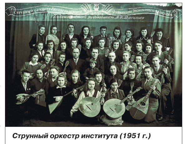
Струнный оркестр института (1951 г.)

тельные бомбы, а после бомбежек ликвидировали их последствия.