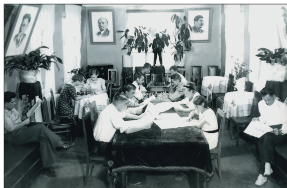
Общезимние ЛФЭИ (1937 г.)