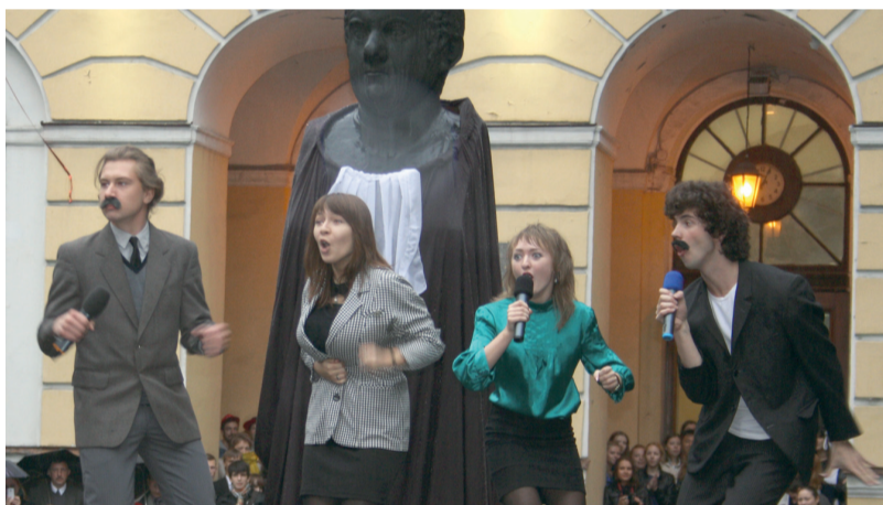
фото: Варвара Мац