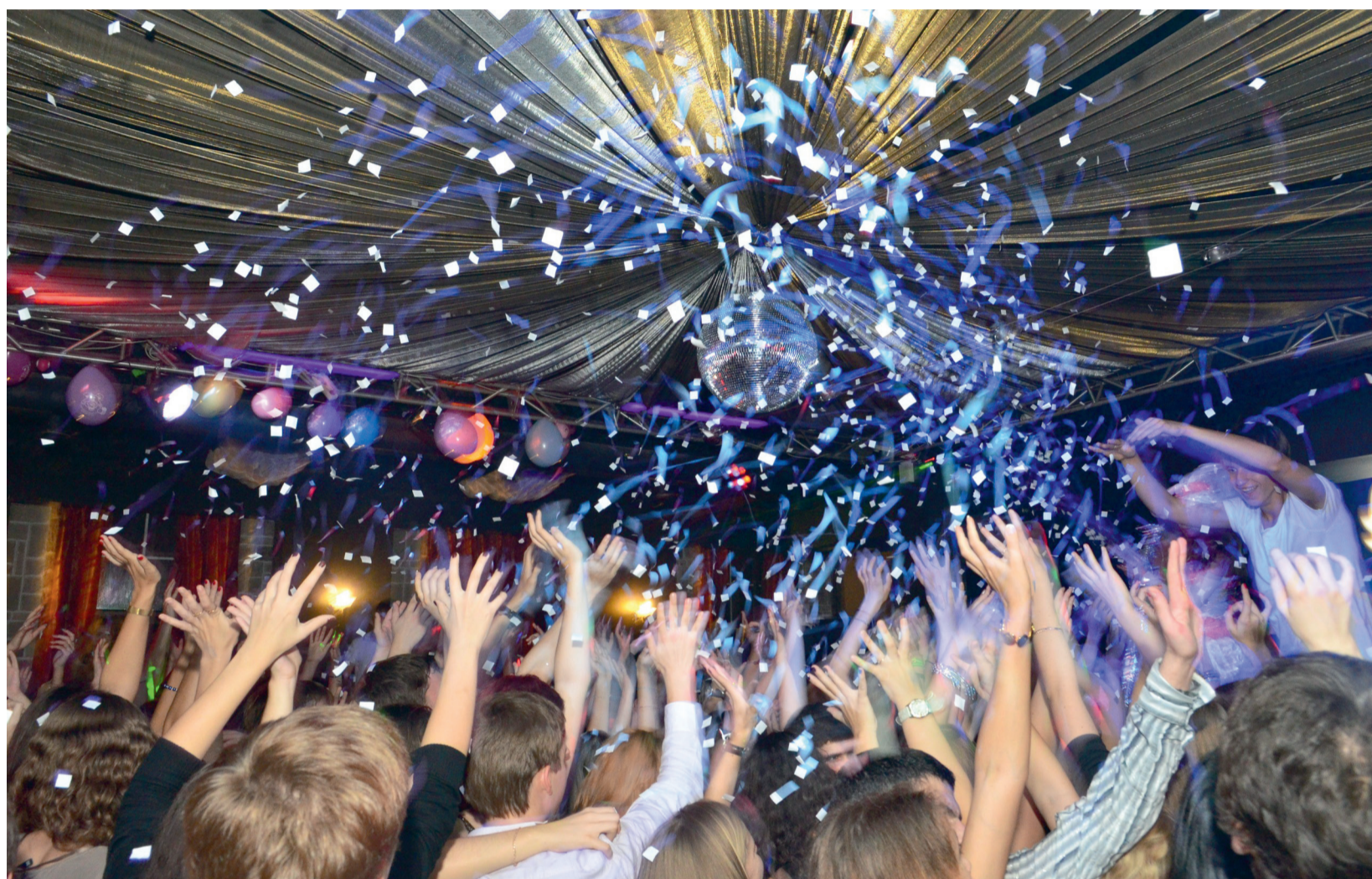
20 сентября первокурсников Финэка посвятили в студенты. Фоторассказ о мероприятии читайте на 4 странице.