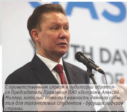
С приветственным словом к аудитории обратился Председатель Правления ПАО «Газпром» Алексей Миллер, который отметил важность данного события для талантливых студентов – будущих лидеров страны.

4-5 октября состоялся Молодежный день Петербургского Международного Газового Форума – уникальная информационная интеллектуальная и полемическая площадка, призванная объединить представителей отраслевой бизнес-элиты и молодежную аудиторию ведущих университетов и институтов мира для обсуждения новых векторов развития газовой отрасли и карьерных возможностей для молодых лидеров.