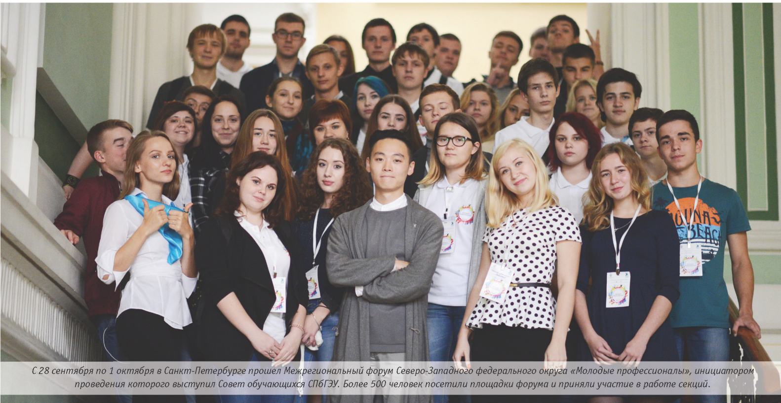
С 28 сентября по 1 октября в Санкт-Петербурге прошел Межрегиональный форум Северо-Западного федерального округа «Молодые профессионалы», инициатором проведения которого выступил Совет обучающихся СПбГЭУ. Более 500 человек посетили площадки форума и приняли участие в работе секций.

ГАЗЕТА САНКТ-ПЕТЕРБУРГСКОГО ГОСУДАРСТВЕННОГО ЭКОНОМИЧЕСКОГО УНИВЕРСИТЕТА WWW.UNECON.RU