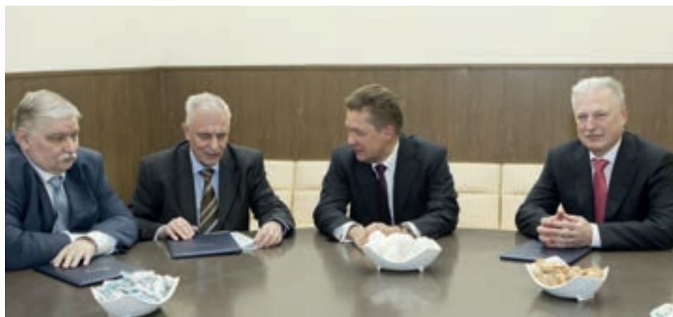
ОБСУЖДЕНИЕ ПЕРСПЕКТИВ РАЗВИТИЯ СПЕЦИАЛИЗИРОВАННОЙ КАФЕДРЫ ПАО «ГАЗПРОМ» НОЯБРЬ, 2014 Г.

– За пятилетний срок работы кафедры были изданы: 2 учебника, 4 учебных пособия, 2 монографии, 8 сборников статей, специальный выпуск журнала «Известия СПбГЭУ», посвященный проблематике ПАО «Газпром».