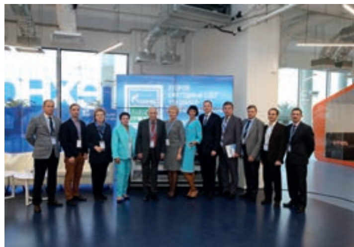
ВТОРОЙ СЛЕТ УЧАЩИХСЯ «ГАЗПРОМ-КЛАССОВ» СОЧИ, НОЯБРЬ, 2017 Г.