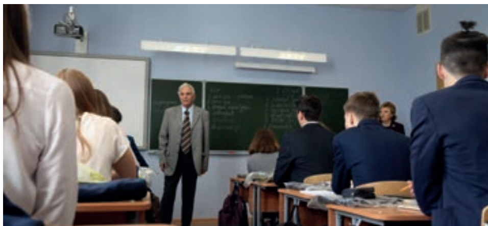
ОТКРЫТИЕ «ГАЗПРОМ-КЛАССА» СЕНТЯБРЬ, 2016 Г.

преимущество компании на внешнем и внутреннем рынках. Важнейшим результатом явилась разработка предложений по решению научно-практических проблем и апробирование научных результатов исследования с применением разнообразного расчетного инструментария. Особый интерес вызвали темы, связанные с обеспечением финансовой устойчивости ПАО «Газпром» в условиях неопределенности факторов внешней среды, совершенствованием тарифного регулирования газовой отрасли, формированием адаптированной под современные реалии системы ключевых показателей эффективности, разработкой корреляционной модели и анализом факторов роста консолидированного ключевого показателя эффективности, созданием системы управления финансовыми рынками с использованием газового аукциона, реализацией стратегии управления издержками в газотранспортной компании в рамках оперативного контроллинга.