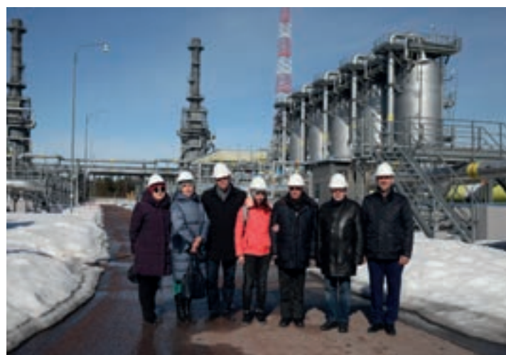
ПОСЕЩЕНИЕ ПРЕПОДАВАТЕЛЯМИ КАФЕДРЫ ОБЪЕКТА ООО «ГАЗПРОМ ТРАНСГАЗ САНКТ-ПЕТЕРБУРГ»

ных блоков и модулей дисциплин на английском языке, с привлечением экспертов от ПАО «Газпром». Предполагается организация бизнес-симуляции трейдинговой активности на базе подразделений Группы Газпром в Санкт-Петербурге.