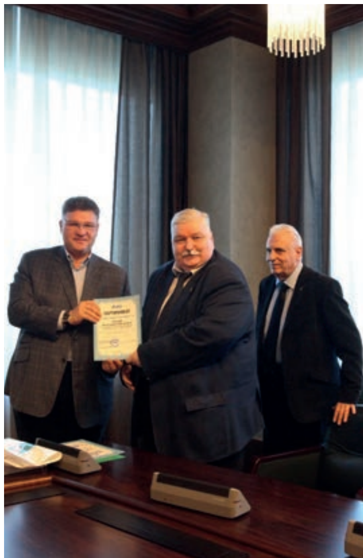
ВРУЧЕНИЕ СЕРТИФИКАТОВ СТАЖИРОВКИ ПРЕПОДАВАТЕЛЕЙ КАФЕДРЫ ПАО «ГАЗПРОМ» В ООО «ГАЗПРОМ ТРАНСГАЗ САНКТ-ПЕТЕРБУРГ»