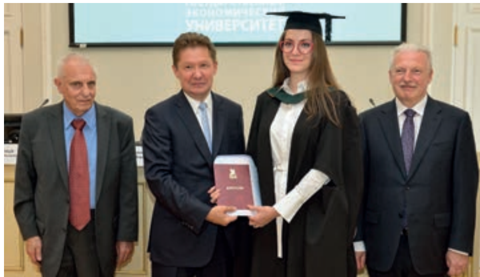
ВРУЧЕНИЕ ДИПЛОМА, 2019 Г.

– Круглые столы и научно-практические семинары посвящены обсуждению наиболее актуальных проблем развития нефтегазового комплекса и ПАО «Газпром», как крупнейшей глобальной энергетической компании.