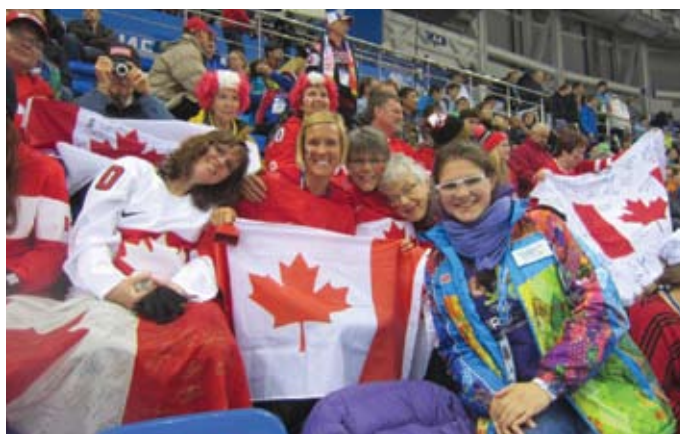
Фотографии с волонтерами в ярких олимпийских костюмах украсят не один альбом.

«На Олимпиаде звучало много знаменитых имен мировых чемпи-