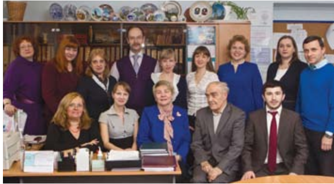
Коллектив кафедры экономики и управления транспортными системами.

Кафедра экономики и менеджмента на транспорте, созданная в 1993 году, выступает правопреемницей кафедры автомобильного транспорта и ставит своей целью не только подготовить востребованных в отрасли специалистов, но и развивать научные исследования и вводить их в практику хозяйствования.