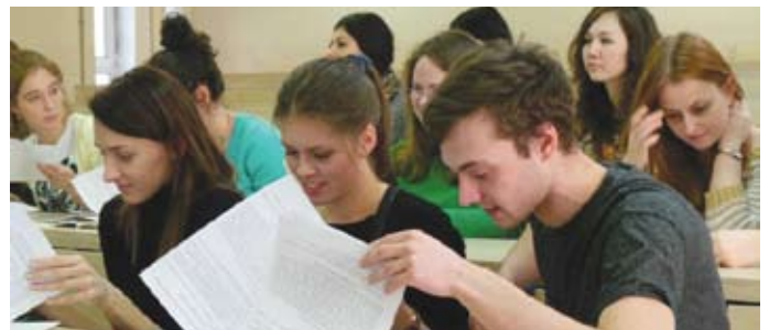
Семь команд разработают маркетинговую программу для строительных объектов во Всеволожском районе.

Конкурс для студентов 2–4-го курсов, обучающихся маркетингу, проходит в форме деловой игры. Студенты разделились на семь команд, каждая из которых разрабатывает маркетинговую программу для выбранного объекта. Конкурирующие проекты будут представлены в формате интеллектуальной дуэли. Каждая команда представит свое видение проекта и ответит на вопросы оппонентов. Публичная