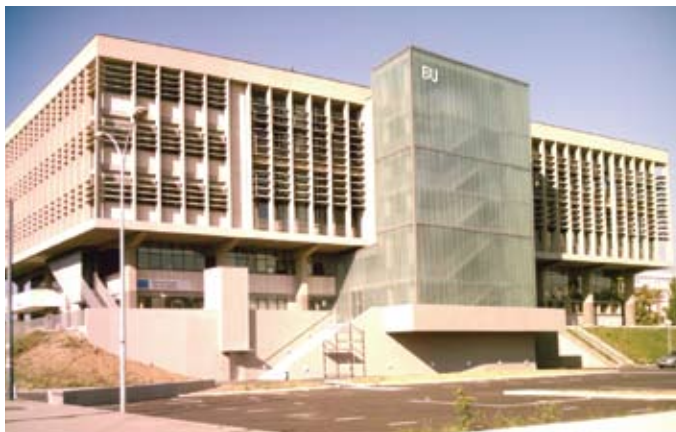
Здание Университета Технологий Клода Бернара в Лионе.