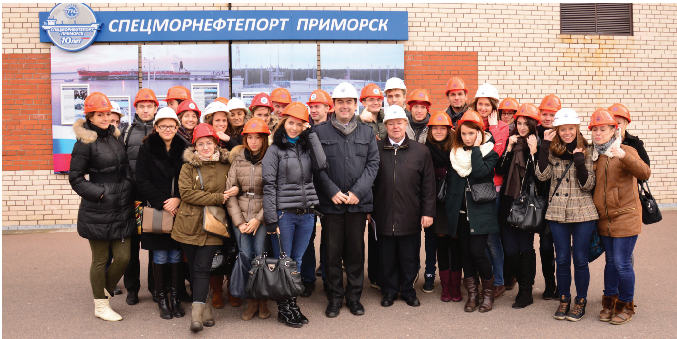
Студенты четвертого курса специальностей «Торговое дело» и «Логистика и управление цепями поставок» на научно-практической экскурсии в одном из крупнейших портов России - в Приморске.