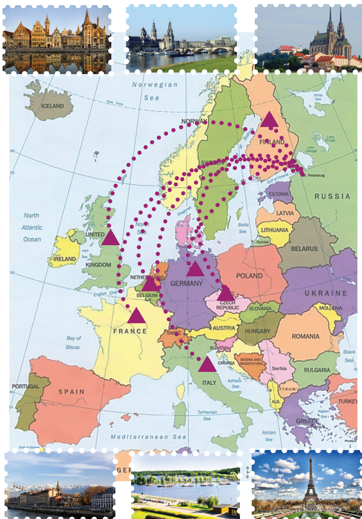
За время обучения в СПбГЭУ вы можете побывать на стажировке в одной из этих стран.

Будущим студентам по обмену я хотела бы пожелать использовать предоставленную нашим университетом возможность прохождения стажировок за рубежом, не бояться пробовать свои силы в отборочном конкурсе. Учеба за границей — это ценный жизненный опыт, новые знания, друзья со всего света и прекрасная строчка в