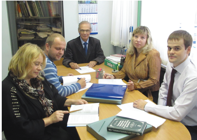
Обсуждение результатов научной работы молодых ученых кафедры.