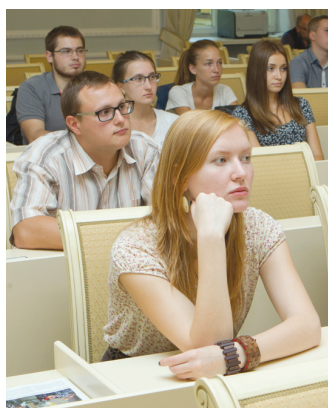
тая, Конго, Кот-д'Ивуара, Монголии, Финляндии и Чехии.

Участие в мероприятии примут студенты российских вузов из всех федеральных округов РФ: Сибирского, Дальневосточного, Северо-Западного, Поволжского, Центрального, Уральского и Южного, а также более ста студентов из иностранных вузов Бельгии, Венгрии, Германии, Греции, Нидерландов, Франции, Вьетнама, Испании, Казахстана, Ки-