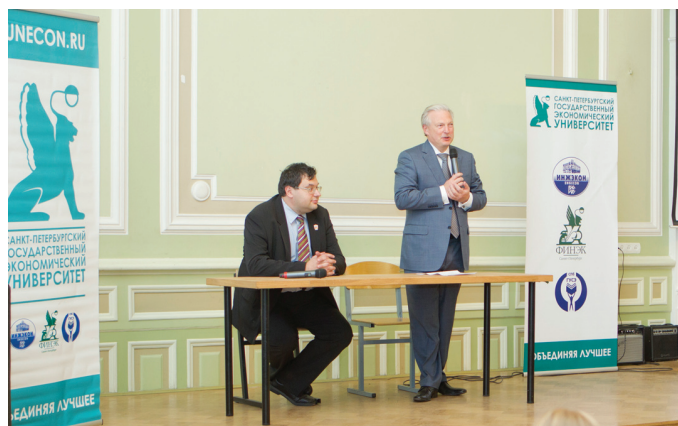
СПбГЭУ — первый в России вуз, получивший неограниченную лицензию на использование компьютерной системы «Wolfram Mathematica».

Более 25-ти лет система «Wolfram Mathematica» является основной средой для проведения расчетов миллионов преподавателей, студентов и других пользователей во всем мире, это одно из самых мощных приложений, которое служит единой платформой для проведения исследований и вычислений.