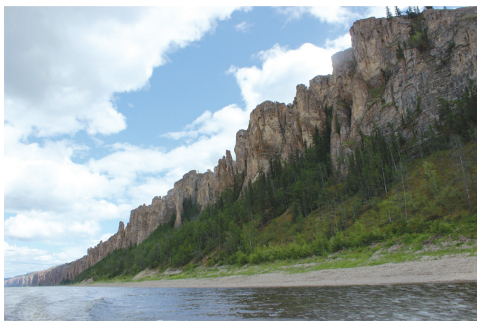
Ленские столбы – сорокакилометровая череда отвесных скал, тянущихся по правому берегу реки Лены.