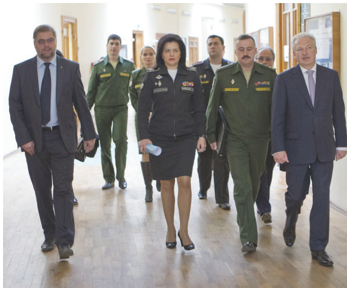
Проект Минобороны РФ вызвал большой интерес среди студентов, что неудивительно, ведь 1 октября в стране стартовал осенний призыв в армию.

«Когда я посещала СПбГЭУ 25 января этого года, мы уже обсуждали возможность военной подготовки студентов без отрыва от образовательного процесса. С этой целью на базе действующих военных кафедр предполагалось создать межвузовские центры военной подготовки, которые будут охватывать не только базовый вуз, но и близлежащие учебные заведения. Соответствующий закон был принят 21 июля 2014 года. Закон реализуется в два этапа. В первую очередь, по всей стране было отобрано 68 вузов, где есть военные кафедры, и 15 тысяч студентов для прохождения военной службы по призыву без отрыва от учебы. Во-вторых, началась работа по созданию межвузовских центров, где с 1 сентября 2015 года пройти воен-