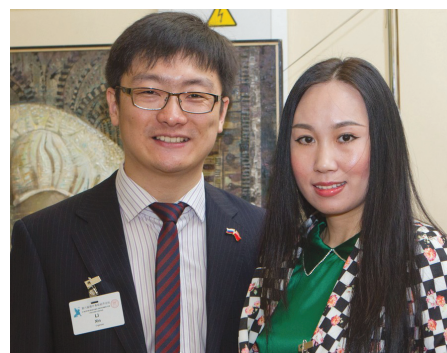
Впервые в рамках форума состоялась конференция молодых ученых.

цент Южно-китайского университета экономики и права Цен Сяньхун отметил, что территориальные изменения российского государства, связанные с присоединением Крыма, повлияют на экономикоторговую политику России. Поскольку ни РФ, ни западные страны не хотят войны — остаются только экономические санкции. Партнерство России с Китаем поможет уменьшить их негативное влияние.