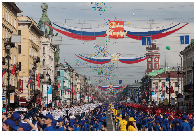
В конце акции «Танцующий Невский» связки воздушных шаров улетели в небо над Петербургом.

Анастасия Кондрашова: «Это оказалось совсем нелегким делом — организовать четыре тысячи человек, ведь большинство танцоров были дети. На каждого волонтера пришлось по 100 участников! До-