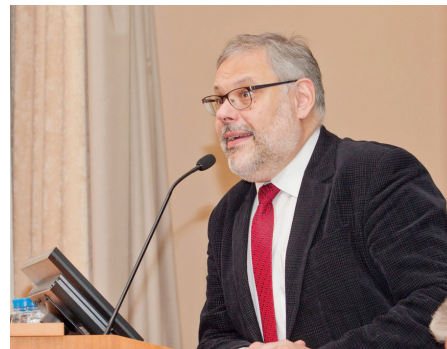
По прогнозам известного экономиста Михаила Хазина, кризис западной экономики неизбежен.

Оценивая стратегическое взаимодействие России и Китая после украинского кризиса, до-