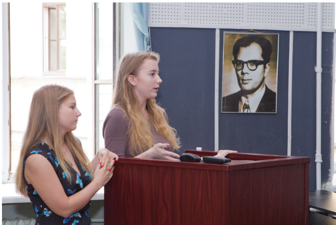
С докладами выступают наши молодые ученые.

В СПбГЭУ прошел первый научный конгресс студентов, магистрантов и аспирантов. В работе 11 круглых столов приняли участие 120 человек. Молодые люди обменялись результатами научной деятельности за учебный год и определили актуальные направления дальнейших исследований.