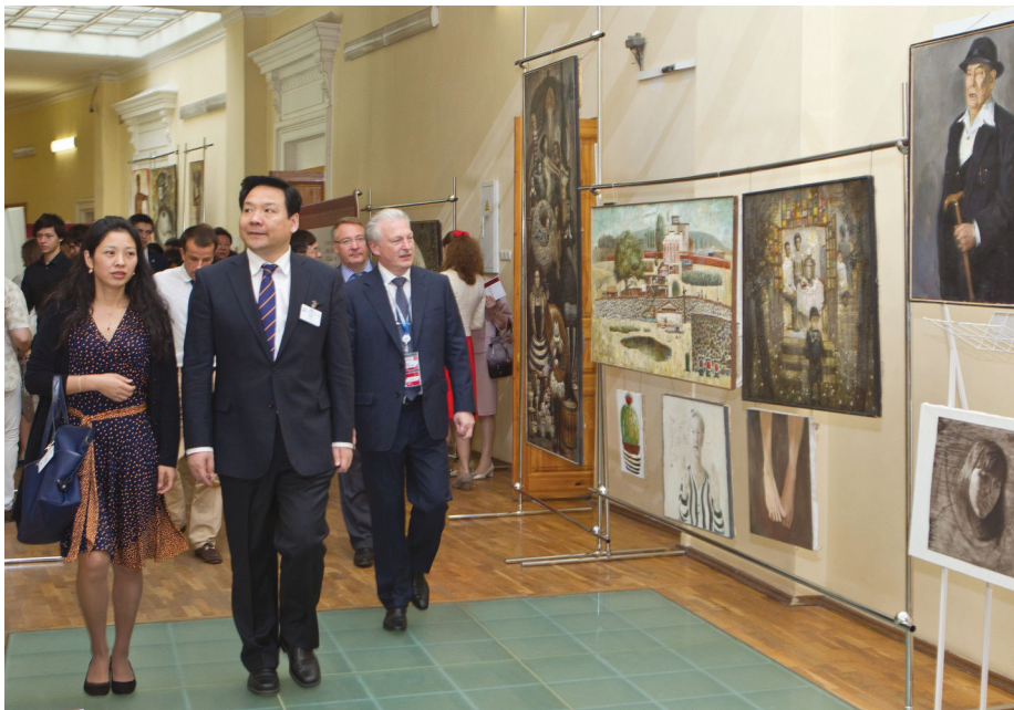
Участники форума на выставке китайских художников в СПбГУ.