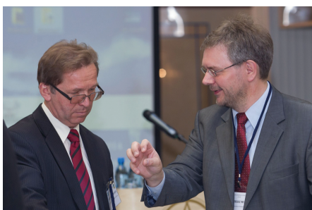
Форум Сети университетов региона Балтийского моря прошел в СПбГЭУ.