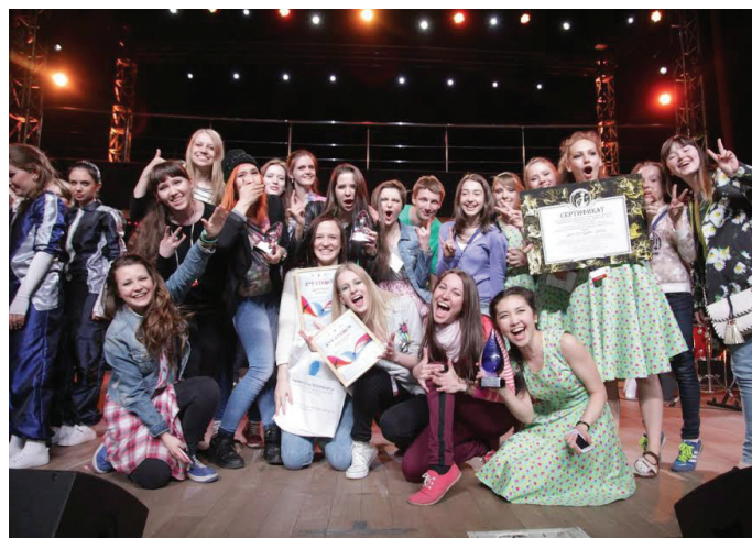
За победу в конкурсе творческий коллектив СПбГЭУ «Right Dance» получил кубок, а также призы и подарочные сертификаты от спонсоров фестиваля.

«Мы и не надеялись получить какие-то награды, ведь для нас главное было, чтобы нас поняли наши зрители и судьи, но как же приятно и неожиданно было услышать название нашего коллектива