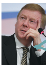
Анатолий Чубайс, председатель правления ОАО «Роснано»:

«Я горжусь дипломом этого вуза, выпускники которого трудятся во всех концах страны, в том числе — на предприятиях «Газпрома» в России и за рубежом. Газпром работает более чем в 30 странах мира. Выпускники Финэка высоко несут там знамя своего родного вуза. Университет учит мыслить системно, экономически, правильно ставить цели, а ведь это — половина успеха в любом деле.»