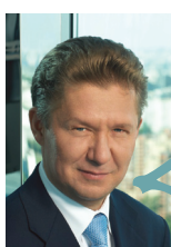
Алексей Миллер, председатель правления ОАО «Газпром»:

СПбГЭУ не случайно называют флагманом высшего экономического образования, знаком качества подготовки специалистов в области экономики. Его выпускники работают во всех отраслях народного хозяйства и с гордостью и уважением вспоминают о родном вузе.