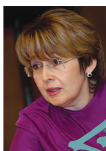
Оксана Дмитриева, заместитель председателя комитета по бюджету и налогам Государственной Думы шестого созыва:

«Я счастлив, что учился именно здесь, и благодарен преподавателям, которые дали мне ценные знания. Мне пришлось работать в разных областях, связанных с энергетикой, и с государственной службой, и с нанотехнологиями. Я на практике узнал, насколько значимо для специалиста соединение инженерного и экономического взгляда. Будущих студентов я призываю уделить особое внимание развитию науки и инновационных проектов.»