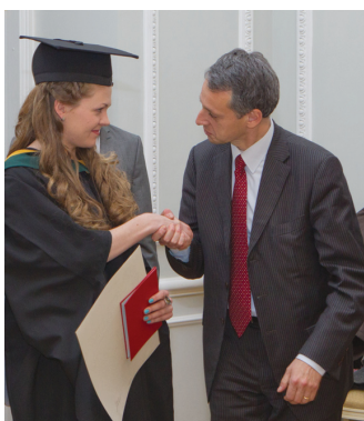
Магистры получили свой диплом из рук представителей Римского университета.