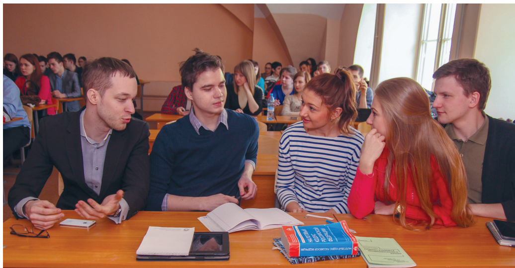
Ребята активно включились в ролевую игру, где состязались в эрудиции и знаниях.

Помимо основной тематики, посвященной налогам, игра была основана на проверке готовности студентов к написанию курсовой работы. Участники команд учились