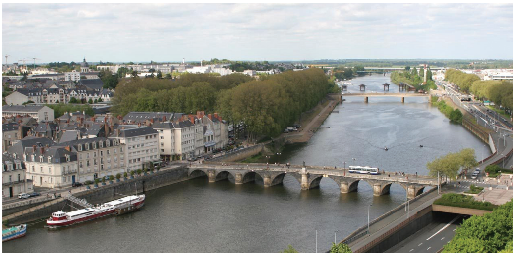
Город Анже богат средневековыми памятниками, парками и уютными кафе.