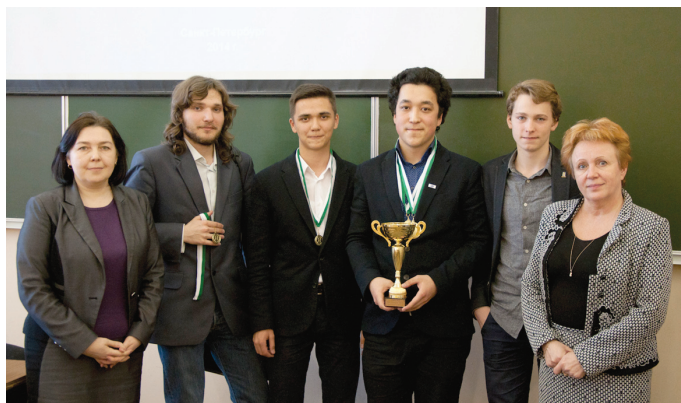
В турнире приняли участие 27 команд, 108 школьников.