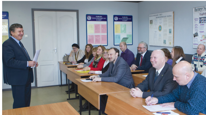
Основная цель НПШ «Экономика» — создание научного знания в сфере финансовых отношений.

Коллектив научной школы внес свой вклад в формирование Программы стратегического развития Санкт-Петербурга до 2030 года, включая разработку конкретных предложений по развитию инновационной и инвестиционной инфраструктуры города; активно участвует по заказу Министерства образования и науки РФ в разработке образовательных программ по направлению «Сервис»; в проектах международных