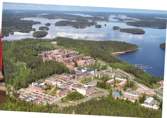
Лаппеенрантский технологический университет, основанный в 1969 году, является первым вузом Финляндии, объединившим в себе бизнес и технологии.

нерские интерьеры современного университета, аудитории, оборудованные по последнему слову техники, система автоматических дверей, позволяющая заниматься даже ночью и в выходные.