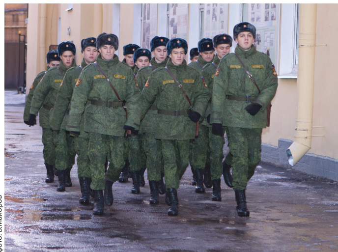
Раз в неделю в течение двух лет юноши, успешно прошедшие конкурс на военную кафедру, надевают форму как настоящие защитники Родины.

Справки по телефону: (812) 310-19-35 с 10.00 до 17.00.