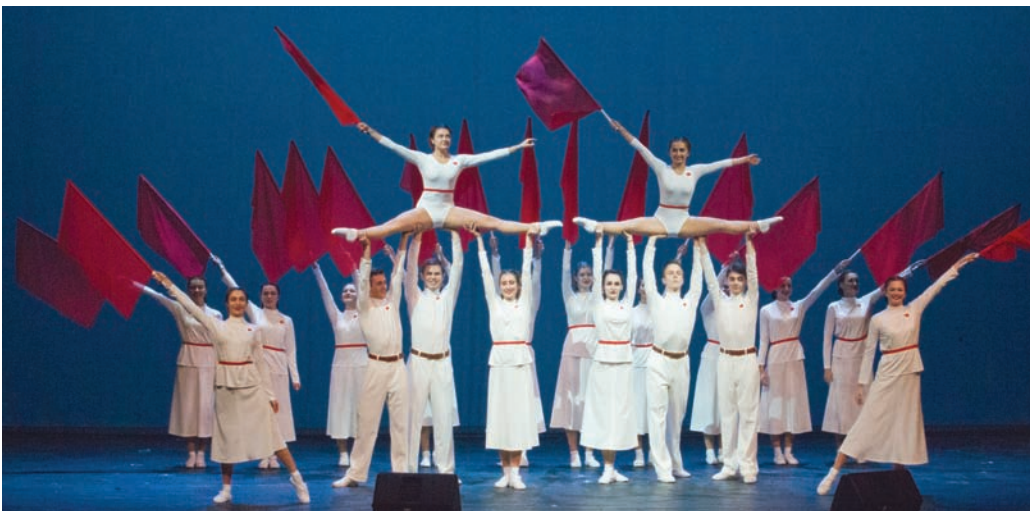
Вечер — воспоминание, вечер — благодарность: такими словами можно охарактеризовать это теплое, можно сказать, семейное, торжество.

Главным в череде юбилейных мероприятий стал концерт в Александринском театре для выпускников, преподавателей, сотрудников и друзей СПбГЭУ.