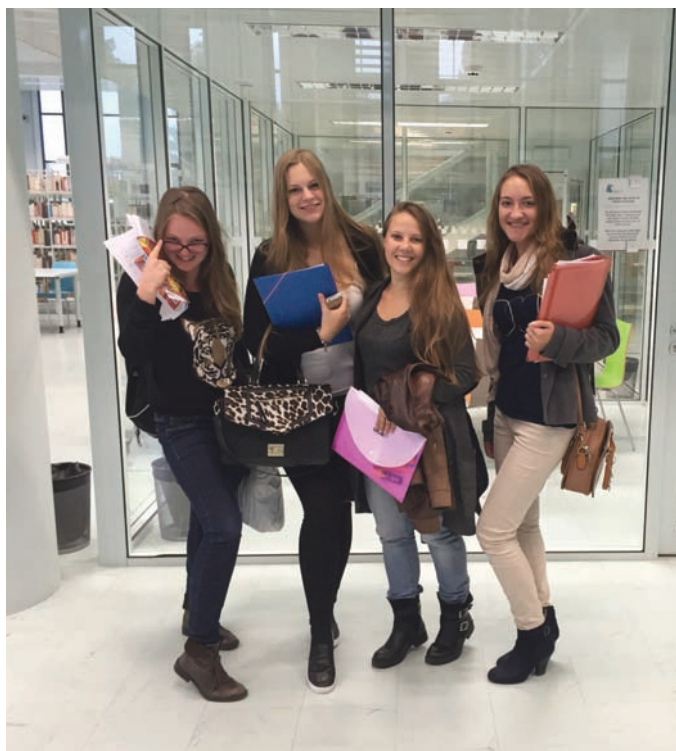
Студентки 3 года обучения на бакалаврской программе уехали во Францию в сентябре 2015 года и вернутся в стены СПбГЭУ только в январе нового 2016 года.