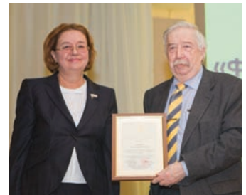
Многим сотрудникам СПбГЭУ были вручены благодарственные письма и грамоты.