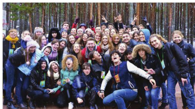
Студенческий совет СПбГЭУ работает по таким направлениям как наука, международное сотрудничество, спорт, туризм, культура и досуг.

Студсовет принимает самое активное участие в организации и