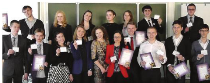
Объединение научной молодежи — одна из главных целей СМУ экономического университета.

Молодые доктора и кандидаты наук, а также аспиранты — члены СМУ, достойно представляли вуз на таких крупных мероприятиях как: Всероссийское совещание советов молодых ученых и спе-