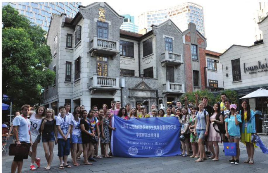
ШОС — региональная международная организация, основанная в 2001 году лидерами Китая, России, Казахстана, Таджикистана, Кыргызии и Узбекистана.

Программа рассчитана на месяц пребывания в Шанхае и включает в себя практические занятия по китайскому языку, лекции о структуре ШОС, ее основных целях и направлениях деятельности, занятия по культуре и истории Китая. Внеучебная часть программы представлена экскурсиями по Шанхаю, знакомством с его основными достопримечательностями и значимыми местами. Кроме того, у участников была возможность узнать обычаи и традиции разных стран через проводимые ими национальные дни.