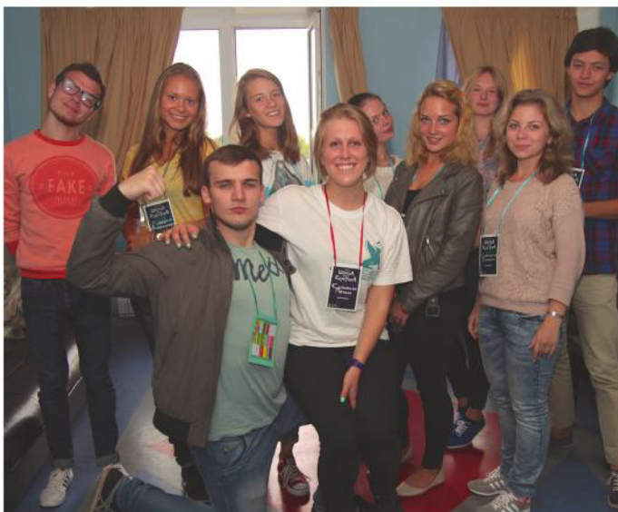
Молодые люди плодотворно провели время — получили полезные знания и отдохнули на побережье Финского залива.

Проект реализуется Управлением по воспитательной и внеучебной работе со студентами совместно со Студенческим советом. Кураторы прикрепляются к каждой учебной группе первокурсников 1 сентября и на протяжении первых шести недель проводят с ними неформальные встречи, на которых новоиспеченные студенты знакомятся, узнают больше о своем вузе и о городе в целом. Это особенно важно для иногородних ребят, число которых в нашем университете растет год от года. Куратор помогает группе избрать старосту, объясняет построение учебного процесса. Однако главная его цель — не просто помочь вчерашним школьникам адаптироваться к