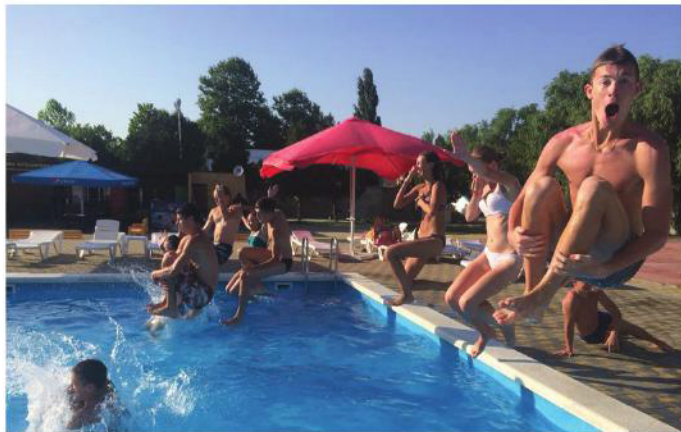
Отдохнувшие и зарядившиеся позитивом студенты выражают благодарность СПбГЭУ за прекрасно проведенное время.

Неутомимые студенты не ограничивались одними развлечениями, с энтузиазмом познава-