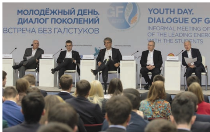
В своих выступлениях спикеры дали советы молодежи, как строить карьеру в энергетической сфере.

Услышать экспертное мнение молодых лидеров газовой отрасли можно было во время интерактивных секций «Газ — топливо будущего. Почему я верю в природный газ?» и «Газовые хабы. Газовые биржи. Новые возможности или барьеры на пути к «золотой эре газа». В число модераторов сек-