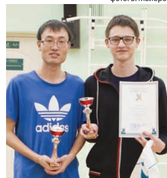
Российские и китайские студенты СПбГЭУ показали себя настоящими мастерами настольного тенниса.