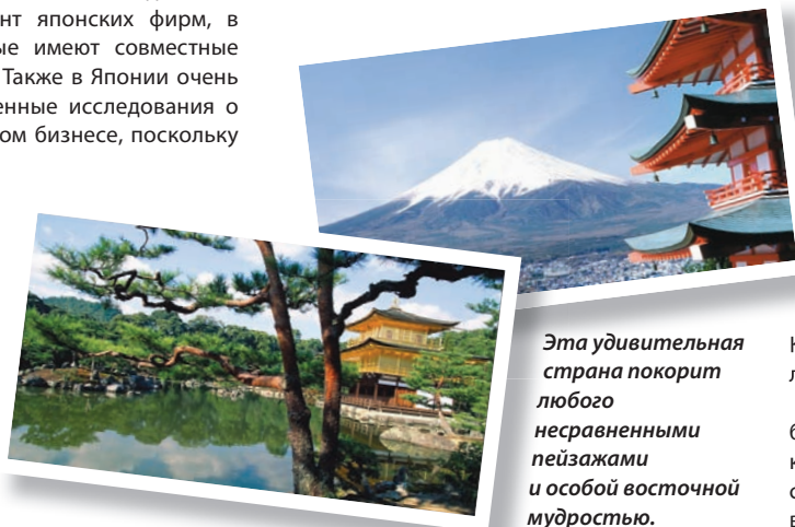
Эта удивительная страна покорит любого несравненными пейзажами и особой восточной мудростью.

международных конференциях в Токио, откорректировать наш новый учебник «Основы бизнеса», который выходит в ноябре в Москве, прочитать лекцию студентам университета города Ниигаты о российском бизнесе, встре-