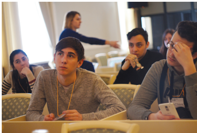
В СПбГЭУ «опробовали» новый формат мероприятий для школьников — будущих абитуриентов и студентов вуза.

посвящен обучению. Ребята ждали лекции по профильным экономическим предметам от преподавателей различных кафедр: финансовая грамотность, проблемы предпри-