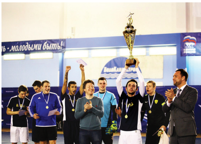
Команды СПбГЭУ оказались лучшими среди петербургских вузов в мини-футболе.

Матч за 3 место завершился победой команды Инженерно-технического университета — 3:1. Финальная встреча проходила в равной и упорной борьбе. Основное время завершилось со счетом 3:3 и, по правилам турнира, для выявления победителя требовалась серия пенальти. В ней точнее