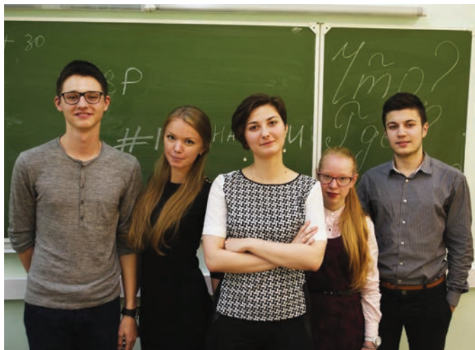
Присоединяйся к команде знатоков СПбГЭУ. Быть эрудированным — модно!

13 мая — открытый турнир «Что? Где? Когда?». В игре примут участие не только студенты нашего университета, но и приглашенные команды.