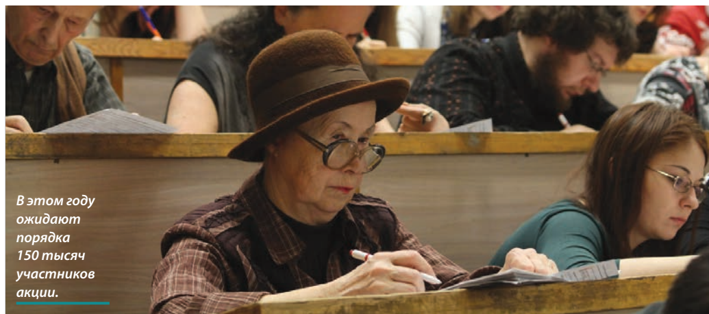
В этом году ожидают порядка 150 тысяч участников акции.

Подробности по адресу: vk.com/energyspsue .