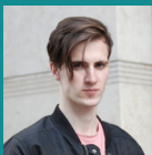
Автор Илья Евдокимов