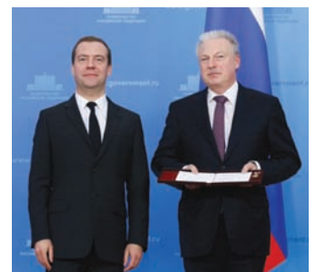
Торжественное вручение премий состоялось 21 января в Доме правительства Российской Федерации.

Всего лауреатами стали 43 соискателя. Премии присуждались за внедрение научно-практических разработок, обеспечивающих развитие научно-технического творчества детей и молодежи, подготовку кадров для инновационных секторов экономики, нефтегазового комплекса, управления качеством, стандартизации и метрологии, подготовку