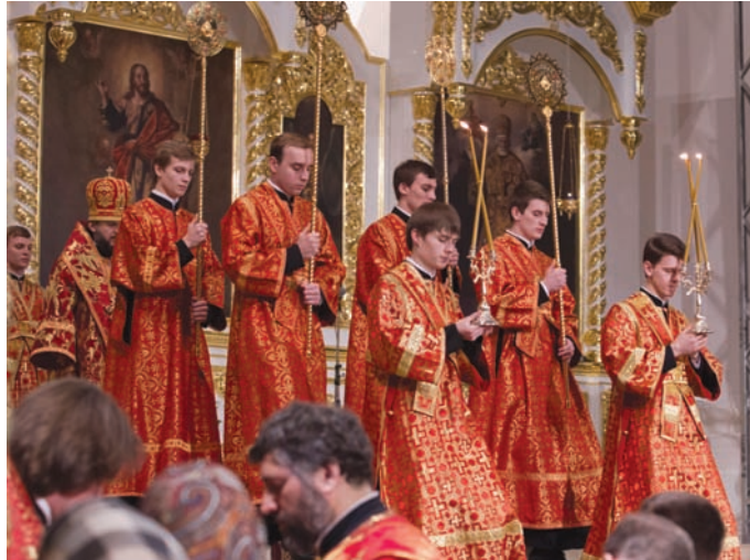
Церемония награждения «Почетным знаком святой Татьяны» проходит ежегодно в Смольном соборе Петербурга в День российского студенчества.

Напомним, что Почетный знак святой Татьяны учрежден в 1996 году и имеет две степени: «Молодежная» (вручается гражданам в возрасте до 35 лет) и «Наставник молодежи» (35 лет и старше). За прошедшие годы обладателями знака стали около 1200 человек. В 2016 году наград удостоились 25 студентов и 17 наставников.