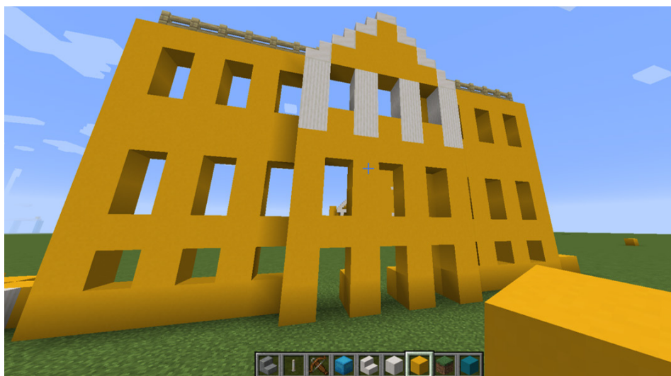
Наша первая модель университета выглядела так

Немного об игровом процессе: весь игровой мир состоит из трехмерных блоков, которые обладают собственной текстурой, физикой и иными параметрами. Базовые действия в игре – добыча блоков, конструирование из них новых объектов и производство игровых инструментов. Модель поведения игрока абсолютно свободна (от пеших прогулок ради любования квадратными пейзажами до строительства грандиозных архитектурных сооружений) и ограничивается только физическими правилами игры. Таким образом,