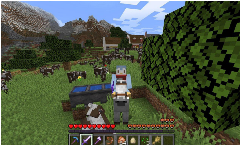
Животноводство в мире Minecraft подразумевает добычу корма для скота, его кормление, разведение и использование в хозяйстве

ключениях, необходимо регулярно добывать себе игровые продукты питания. В самом элементарном виде это может выглядеть, как охота на диких животных или собирательство, однако более «калорийные» продукты требуют применения определенных технологий.