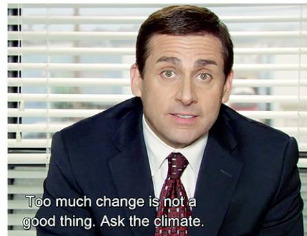
Too much change is not a good thing. Ask the climate.

Откровенно говоря, мой дедушка был куда более «экофрендли», стирая пластиковые пакеты, а не выкидывая их, чем «борцы», подписанные на «How to Green» и тыкающие в лицо многоразовые мешочки для овощей или готовые разорвать за полиэтилен.