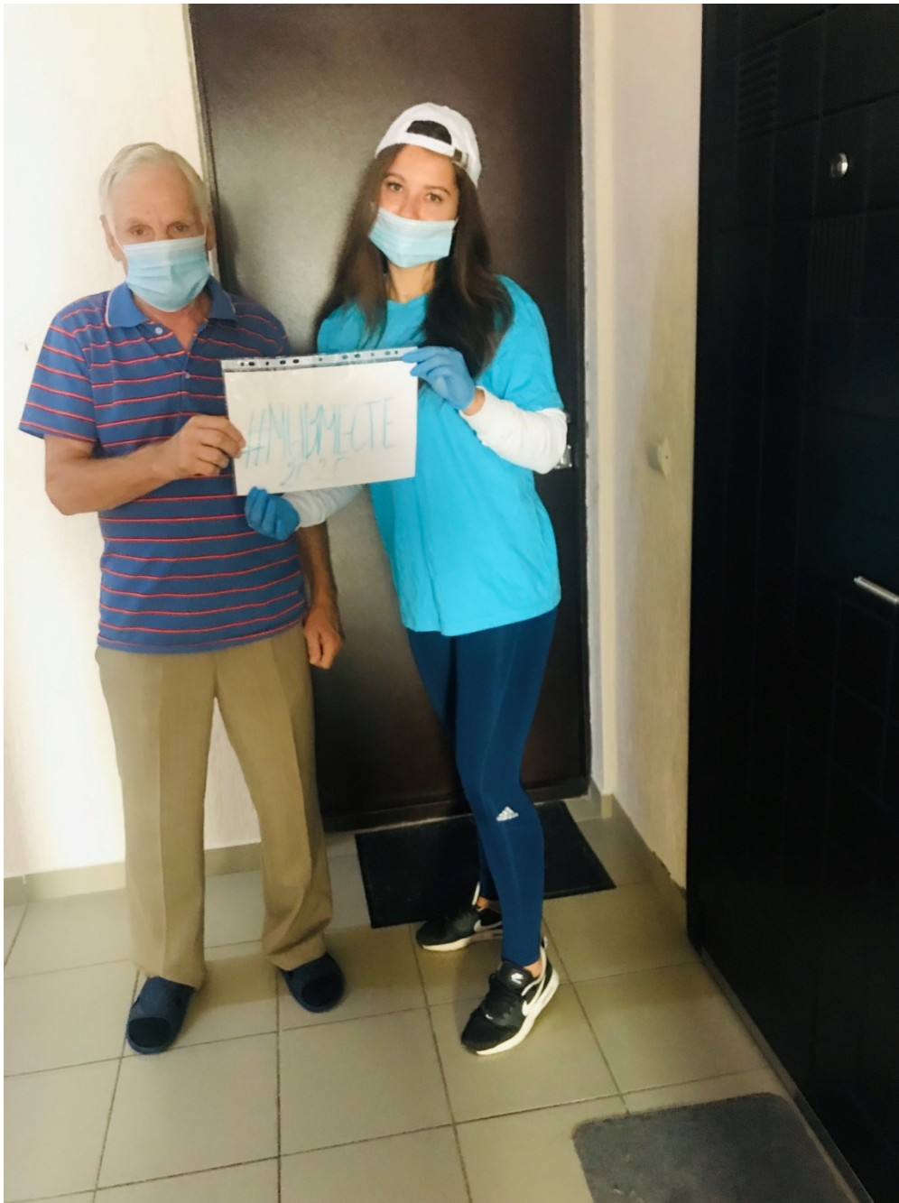
Фото 1. Благотворительная акция «Тележка добра» для пожилых людей проехала по городу Краснодару