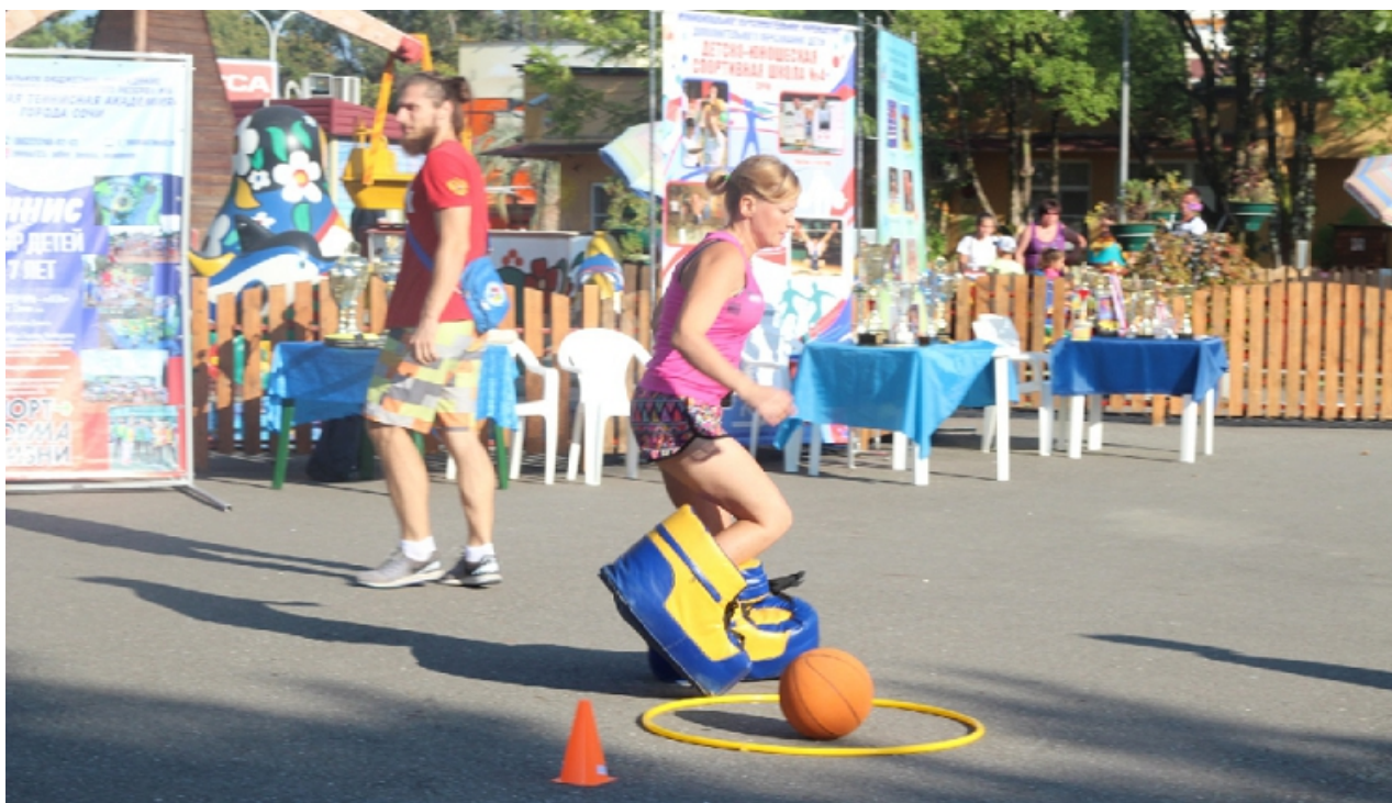
Фото 4. День физкультурника в Сочи. Эстафета мам в надувных ботинках.