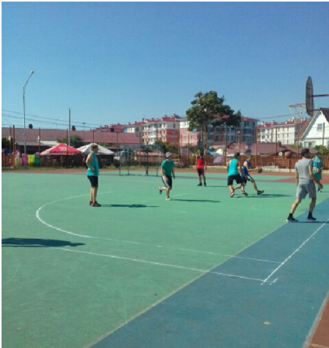
Фото 9. Соревнования по стритболу в г. Сочи.

Как показало проведенное информационное исследование с использованием метода исторического факта, сегодня День физкультурника имеет свои особенности, но традиции советского времени бережно сохраняются для подрастающего поколения.