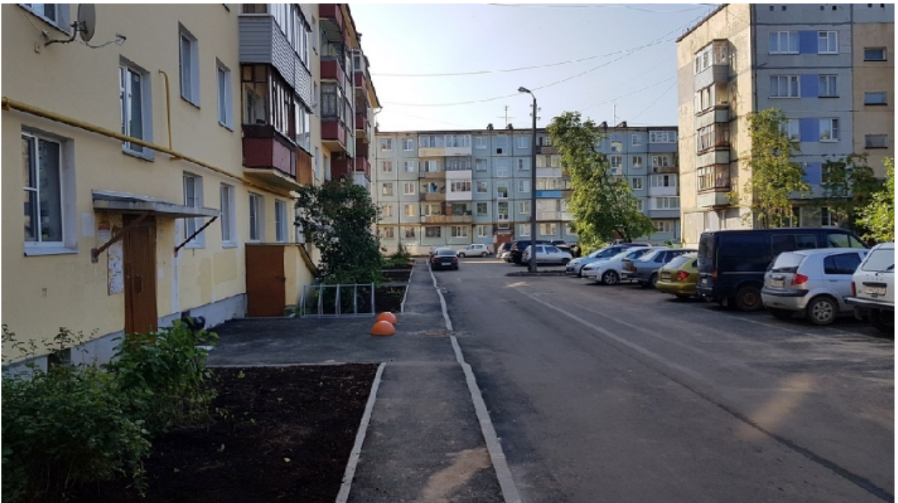
Фото 2. Комфортная городская среда наглядно: капитальный ремонт дворовой территории у дома по ул. Ветошкина 18 (на фотографии двор после ремонта).

В инициативном распределении бюджетных средств в 2017 по программе формирования комфортной среды приняли участие четыре муниципальных образования региона: Вологда, Череповец, Сокол и Великий Устюг. Голосование за общественные пространства, которые, по мнению населения, должны быть благоустроены в первую очередь, проводилось параллельно с выборами Президента Российской Федерации, что обеспечило высокий процент участия — 35%.