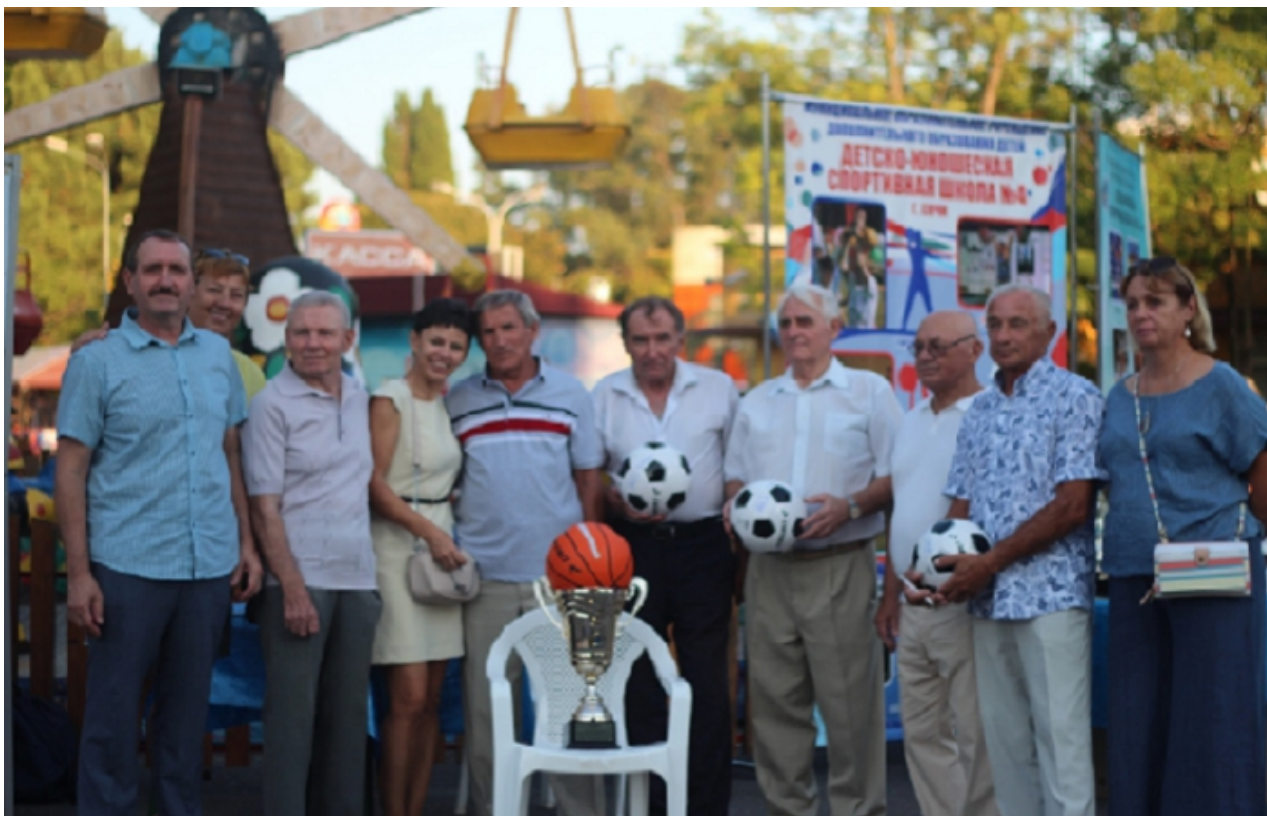
Фото 1. Ветераны спорта на награждении в Парке культуры и отдыха.

приглашены ветераны спорта и спортивного движения в Адлерском районе (фото 1, 2).