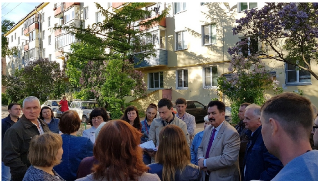
Фото 1. На фотографии двор по ул. Ветошкина 18 до ремонта.

Результаты реализации проекта представлены фотографиями дворовых территорий дома по ул. Ветошкина 18 до и после ремонта (фото 1 и 2).