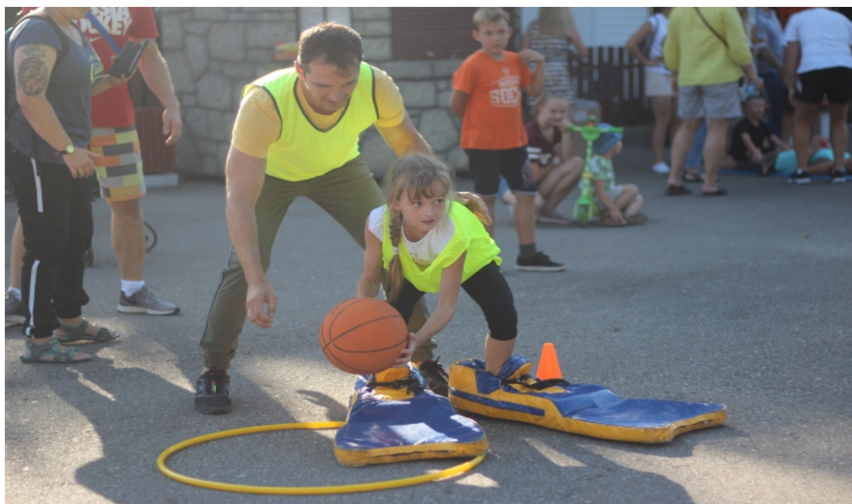
Фото 5. Мой ПАПА поможет стать мне первой!