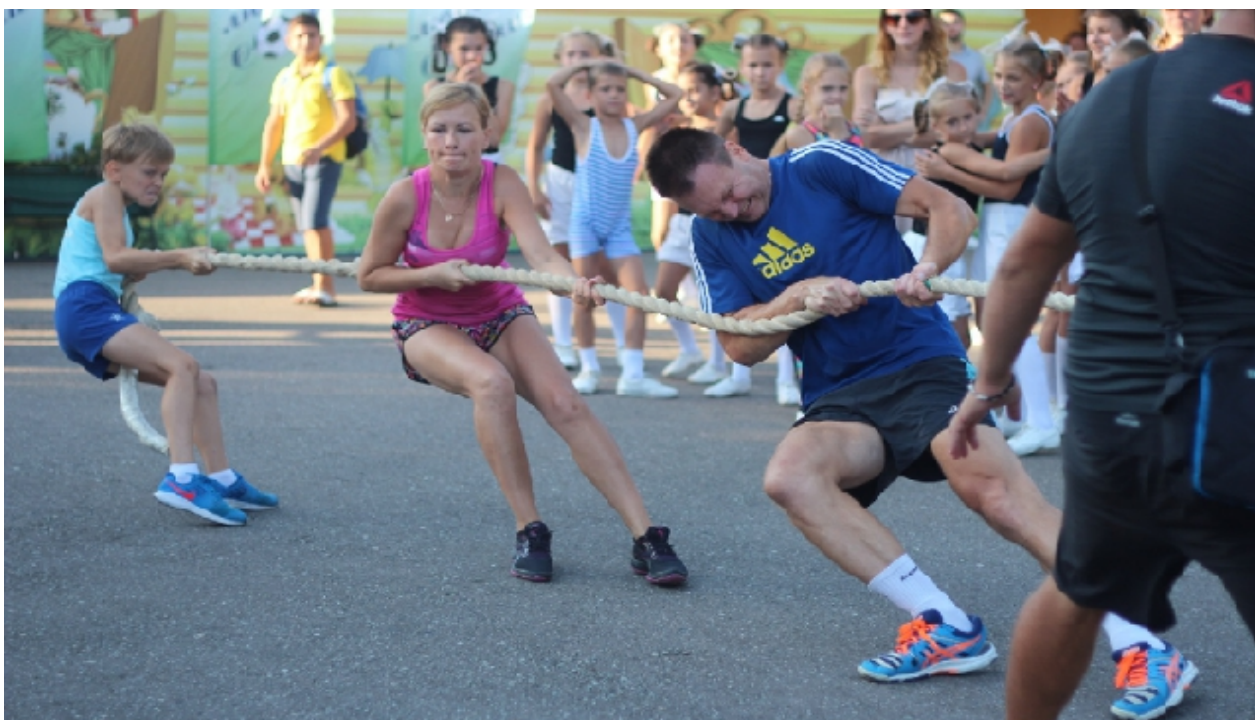
Фото 3. Конкурс семей на празднике. Перетягивание каната.

Хорошей традицией спортивных мероприятий Сочи стало участие в них спортивных семей. В празднование Дня физкультурника был включен конкурс «Спортивная семья».