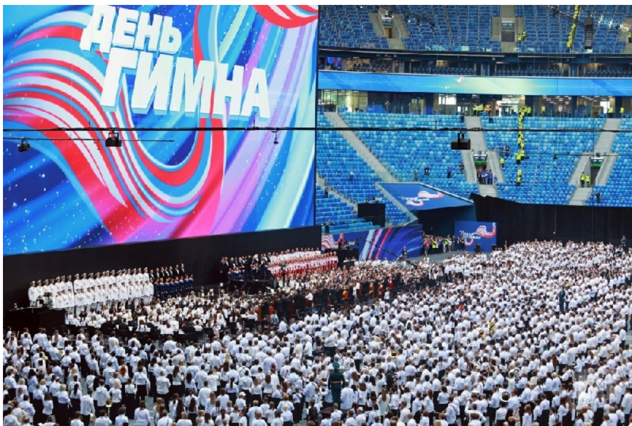
Фото 4. Исполнение 8 097 музыкантами и 30 000 певцами гимна России на стадионе «Газпром Арена» в Санкт-Петербурге.

6-7 сентября в конгрессно-выставочном центре «Экспофорум» с участием наших волонтеров состоялась четырнадцатая общественная акция «Выбираю спорт!» — ежегодное мероприятие, сочетающее в себе черты выставки и большого общегородского праздника для всех, кто любит спорт и активный отдых.