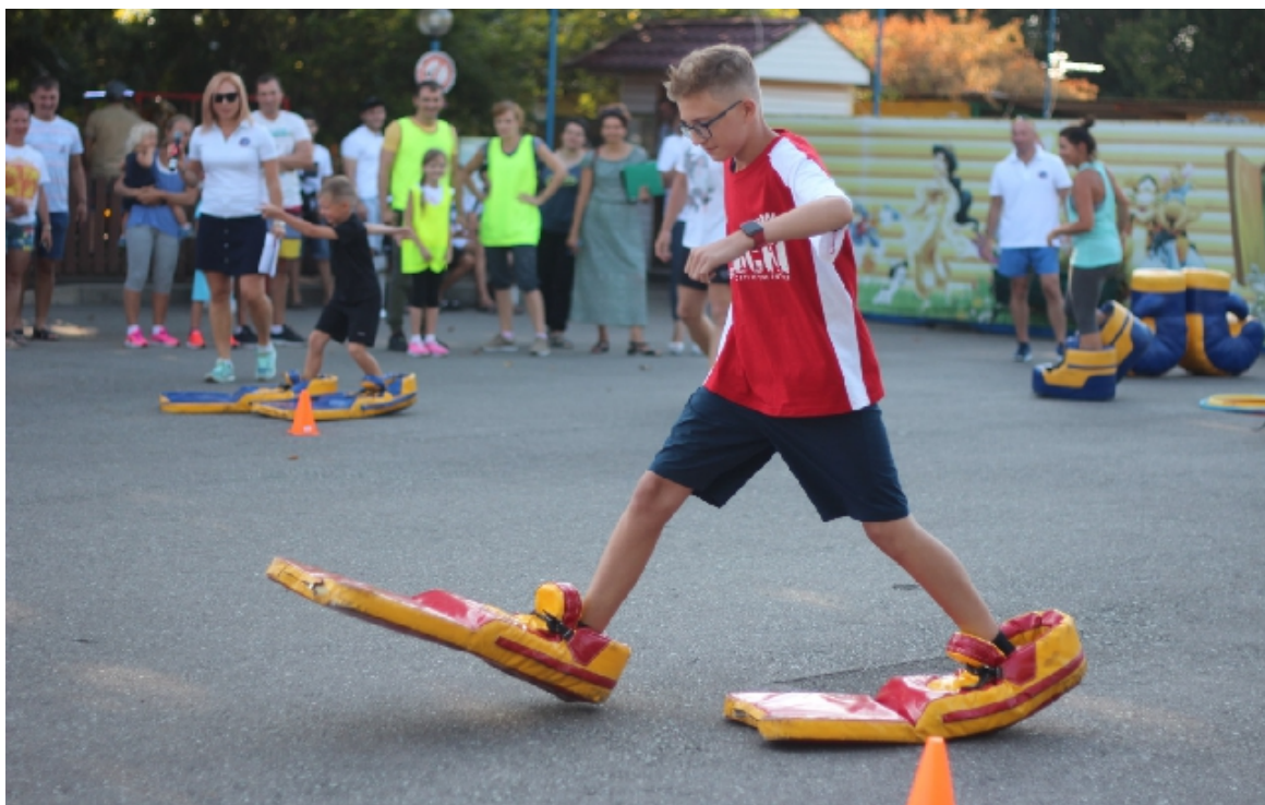
Фото 6. Эстафета в надувных ластах.