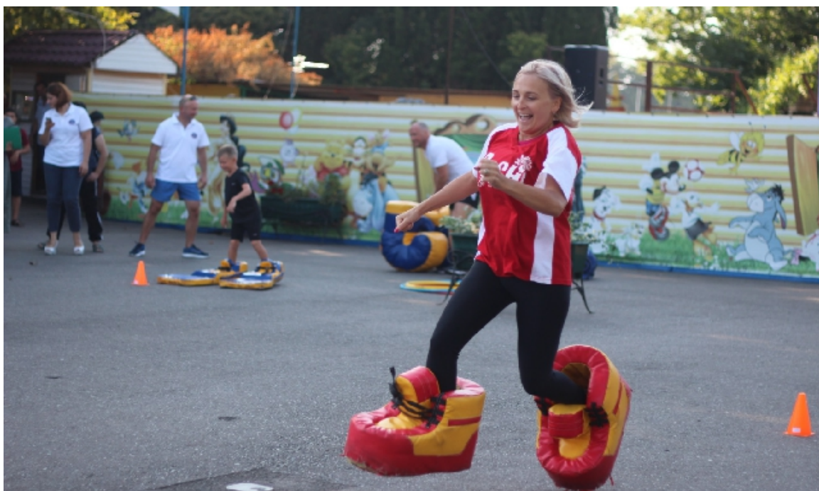
Фото 7. Моя МАМА — самая быстрая!