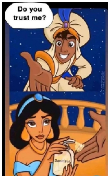
Рис. 4. В этой ситуации не каждая принцесса согласится взять за руку своего возлюбленного.