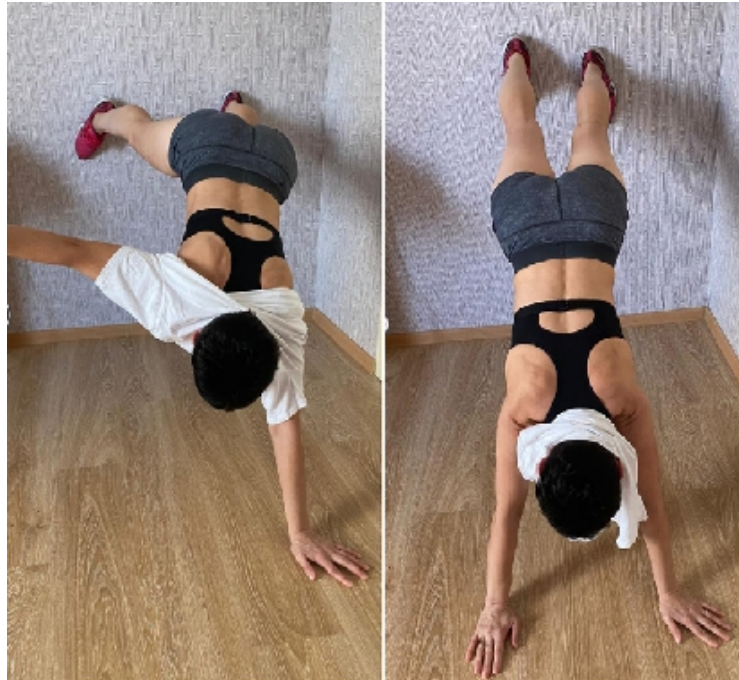
Фото 2. Сравнение движений в разных биомеханических позах: одна точка опоры (на одной руке) и две точки опоры (на двух руках).