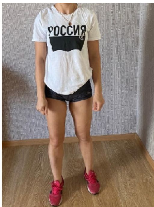
Фото 4. Россия, вперед! С Днем космонавтики! Упор на обе ноги в вертикальном положении. Упражнение окончено. Идет восстановление дыхания.