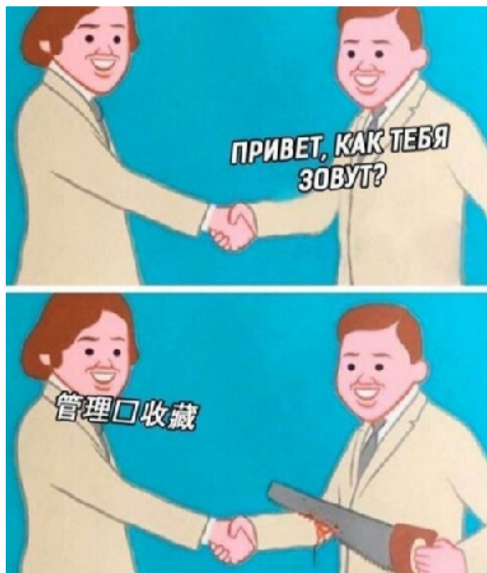
Рис. 3. Избегайте тесных контактов! НЕЛЬЗЯ ВСЕМ пожимать руки, обнимать друг друга, целоваться!

Интернет-мемы нашей выборки дают рекомендации, например, о том, как правильно мыть руки, чтобы не заразиться коронавирусом, как выбирать нужный антисептик (рис. 4), советы о том, что не следует поддаваться паническим настроениям: проявлением начинавшейся в обществе паники стало, в частности, то, что в магазинах моментально раскупалась туалетная бумага, а гречневая крупа становилась «продуктовым бестселлером» (рис. 5) и др.