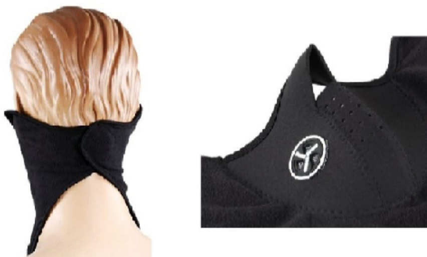
Рис. 4. Защитная маска для дыхания с отверстиями, 490 рублей. Страна-изготовитель: Китай. Интернет-магазин MELEON < meleon@meleon.ru >.