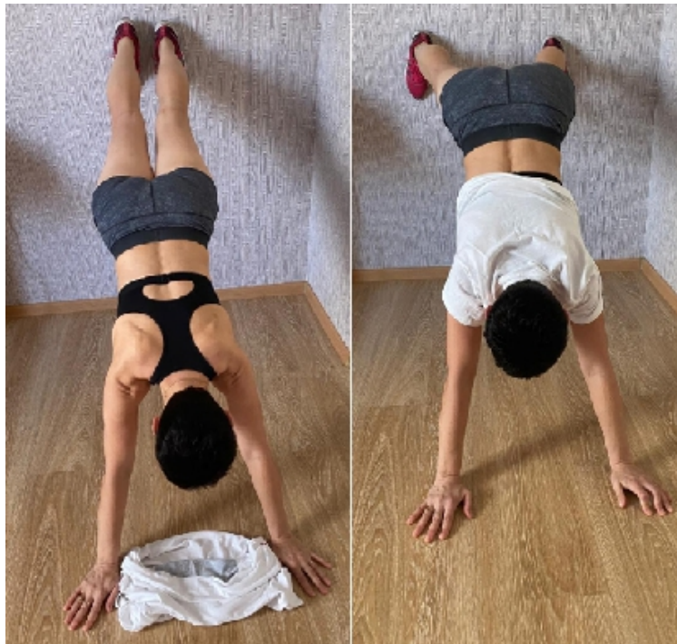
Фото 1. Упражнение в стойке на руках с упором о стену.