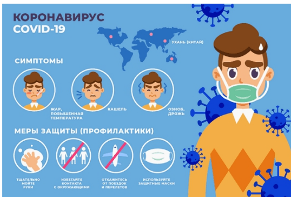
Рис. 3. Заходить в магазин в г. Краснодаре можно только в маске (постановление губернатора).

Главным отрицательным фактором ношения масок оказалось затруднение дыхания, поэтому без специальных навыков дыхания некоторые виды масок лучше не использовать.