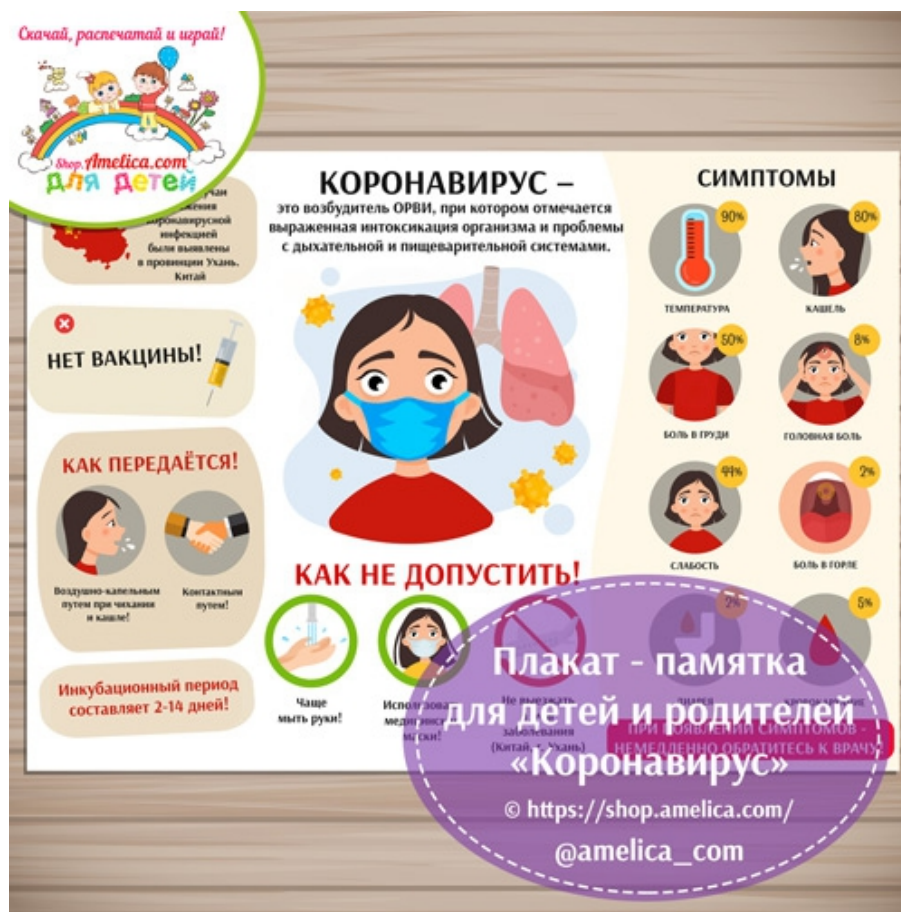
Рис. 1. Памятка для родителей в подъезде дома.

магазины различные виды масок, призванные защитить от заболевших коронавирусом Covid-19, который передается воздушно-капельным путем.