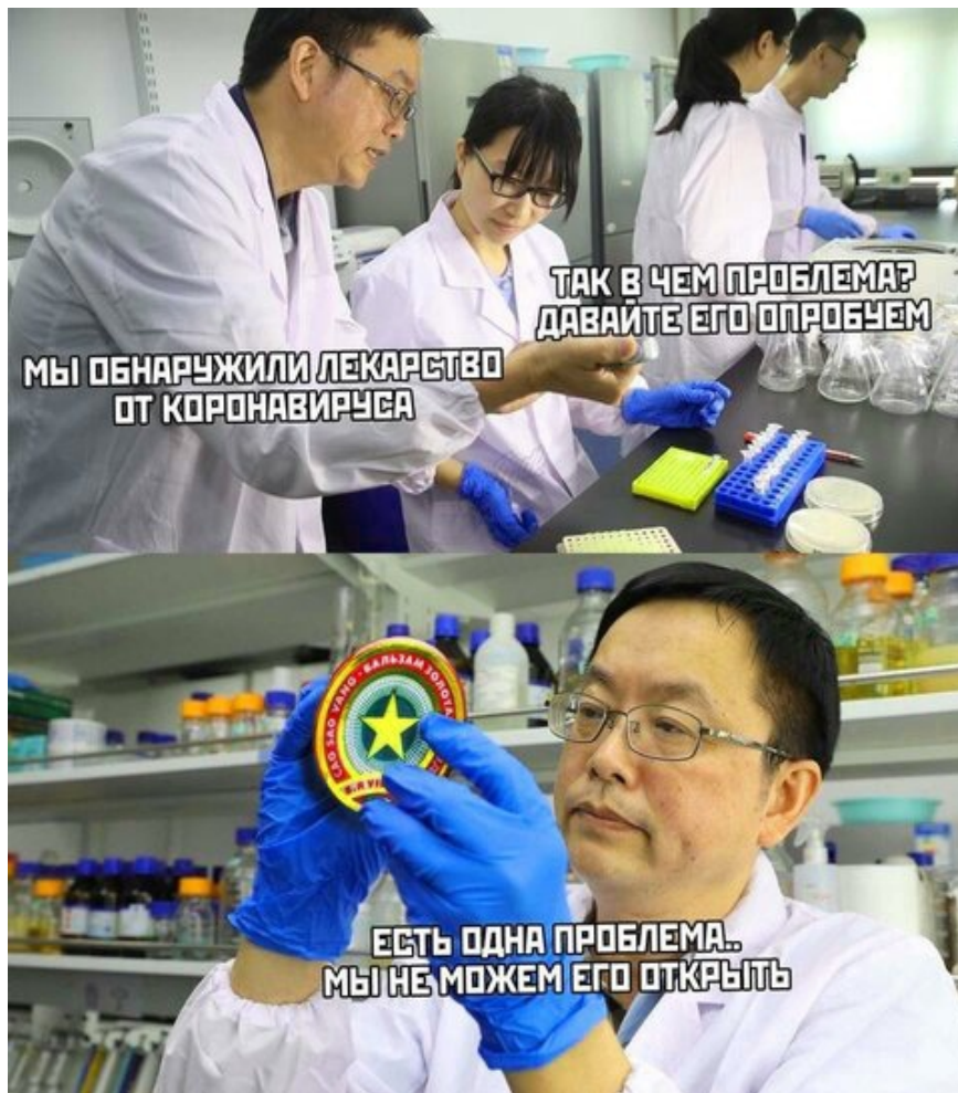
Рис. 2. Китайцы о коронавирусе.

прошлого 2019 года, и с каждым днем вопросов по поводу штамма становится только больше, так как вирус еще мало изучен.