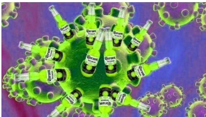
Рис. 6. Представление коронавируса в сознании молодых людей.

Однако в интернет-источниках представлено много интернет-мемов абсурдных, которые извращают суть происходящего, не несут достоверной информации, не передают актуальных рекомендаций, направленных на защиту человека, вводят людей в заблуждение, создавая в их сознании внутренний конфликт. Порой интернет-мемы допускают неэтичность, злую насмешку, глумление, выражают социальную бестактность, циничность, распущенность их авторов, используют жаргонизмы, бранные выражения и т. д.