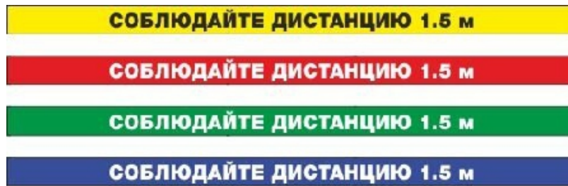
Рис.2. Соблюдайте дистанцию! (Призыв в магазине).