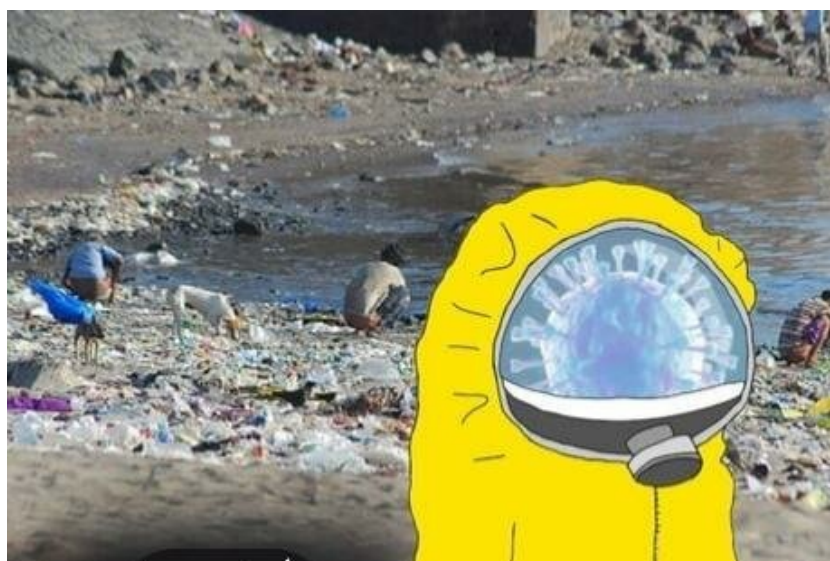
Рис. 1. Коронавирус в Индии.

Путем информационного анализа интернет-источников удалось выявить и представить интернет-мемы о распространившемся коронавирусе глазами людей в разных странах [17]. Мы собрали несколько интернет-мемов о коронавирусе, показывающих социальную сущность этого страшного явления XXI века, которое может восприниматься и с юмором, не всегда всерьез [3, 7, 12].