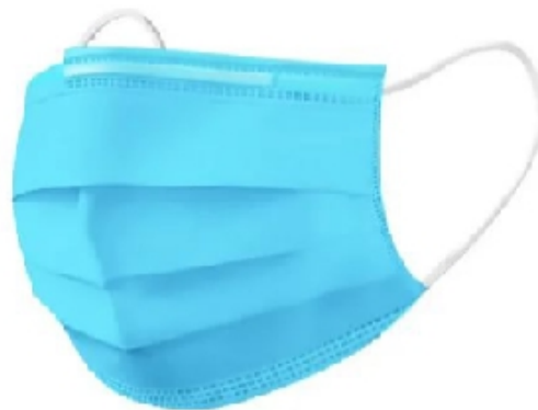
Рис. 6. Маска трехслойная.

Самый распространенный тип маски в России и других странах — маска трехслойная (рис. 6).