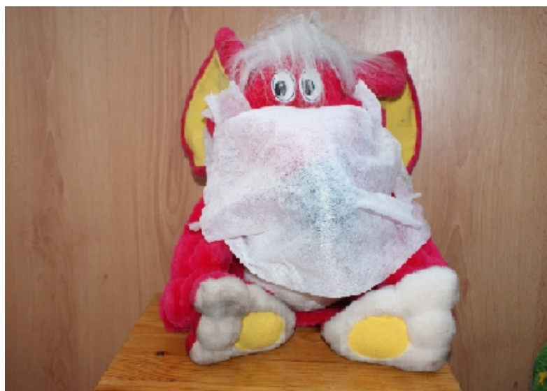
Рис. 7. Covid-19, не подходи!

В сети магазинов «Магнит» г. Краснодара покупателям на входе выдавали разовые маски (рис. 7):