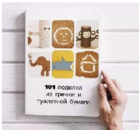
Рис. 5. Не надо поддаваться панике, покупайте продукты разумно.

Коронавирус, пандемия несут опасность жизни человека, миллионов людей. Интернет-мем на подобную тему должен быть направлен