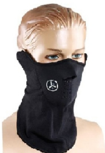
Рис. 5. Защитная маска для дыхания с отверстиями.

Эргономические свойства товара (рис. 5), заявленные в рекламе: «Подходит для лыжников, сноубордистов и велосипедистов. Защитная маска с отверстиями для дыхания. Ветер, пыль и холод не только мешают