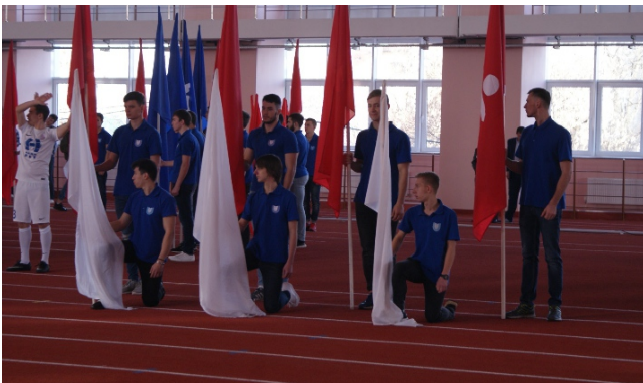
Фото 1. Открытие нового спортивного комплекса.

Город Краснодар называют спортивной столицей Кубани. В городе строятся современные спортивные сооружения, открывающие путь для занятий спортом детей и взрослых [3]. После реконструкции введен легкоатлетический манеж Кубанского государственного университета физической культуры, спорта и туризма (КГУФКСТ).