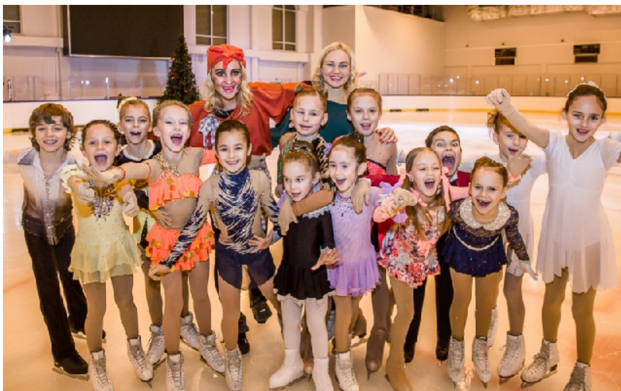
Фото 2. Школа фигурного катания и детский театр на льду.