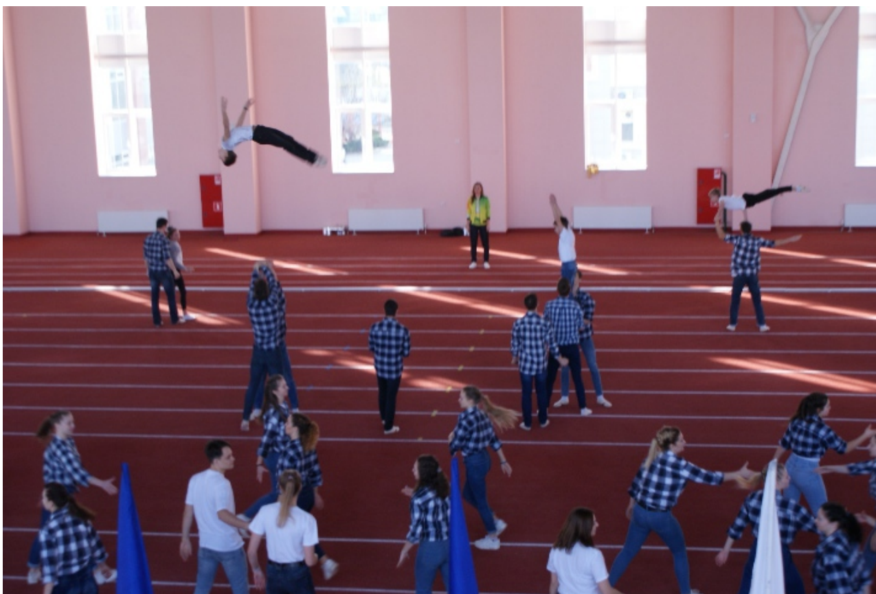
Фото 4. Выступление студентов на новом манеже.