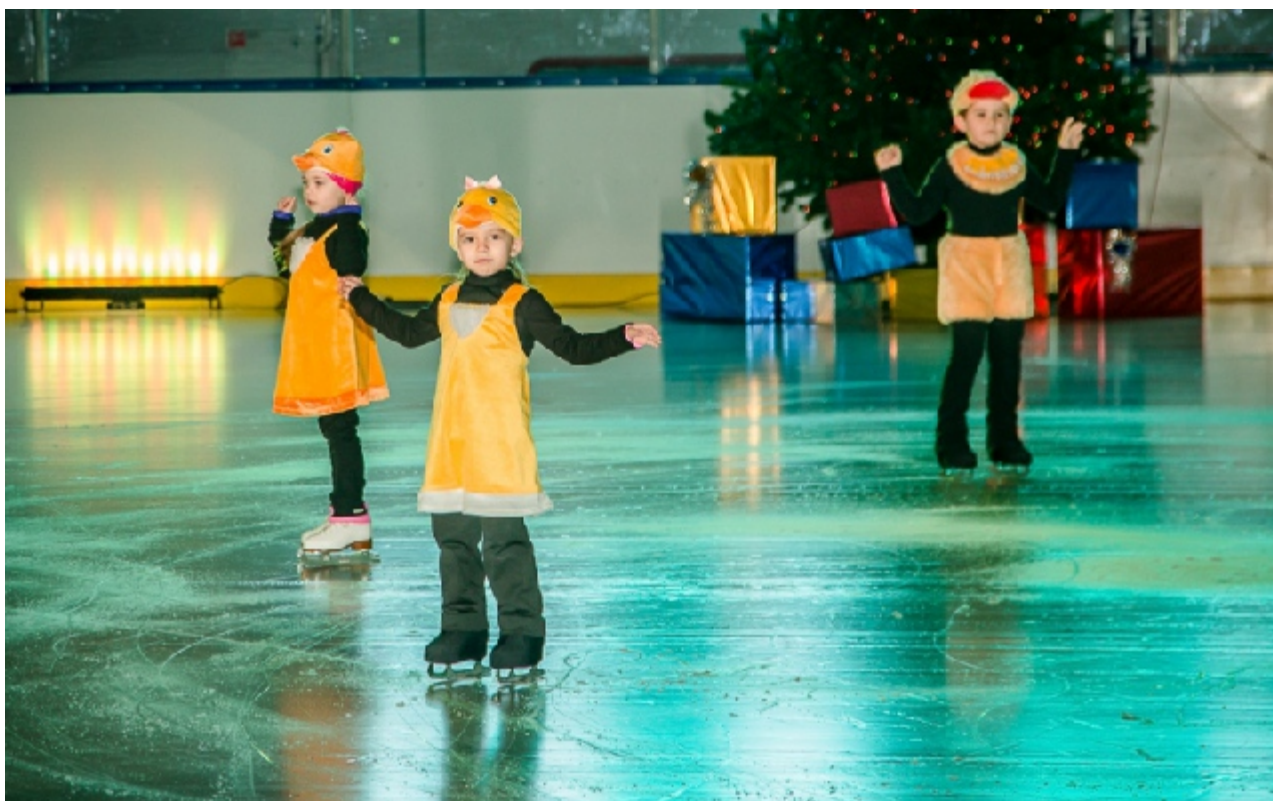
Фото 3. Школа фигурного катания и детский театр на льду.

— Очень удобно: близко к дому, и занятия здесь после уроков в школе. Когда попали в это царство фигурного катания, были в восторге от прекрасного дворца, тренеров, директора.