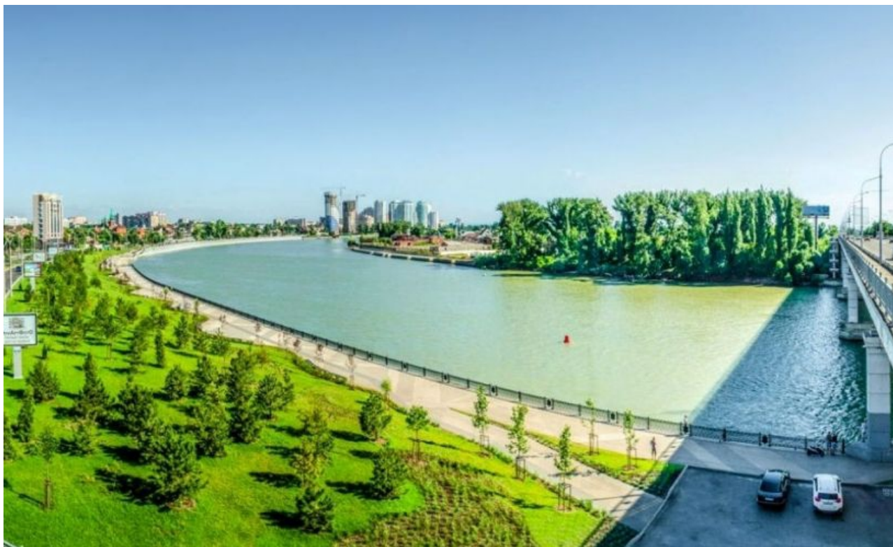
Фото 3. Велодорожка от Моста поцелуев.

Маршрут 3. Велодорожка от Моста поцелуев.