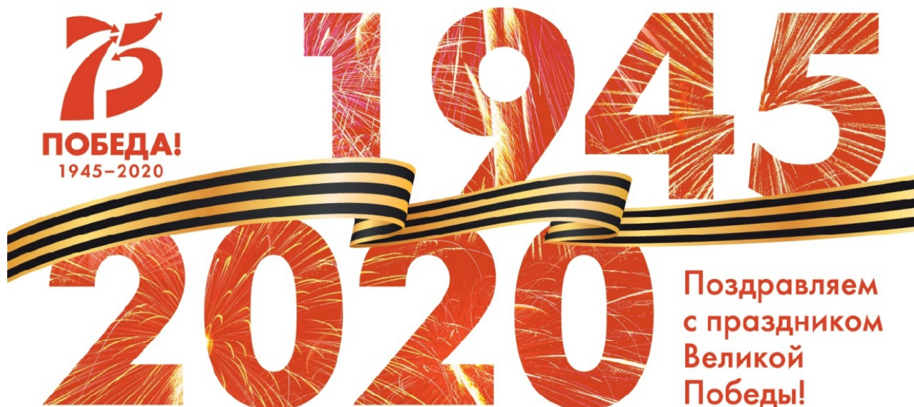
Фото 1. Логотип праздника.

формате с использованием различных аудиовизуальных технологий (фото 1) [9].