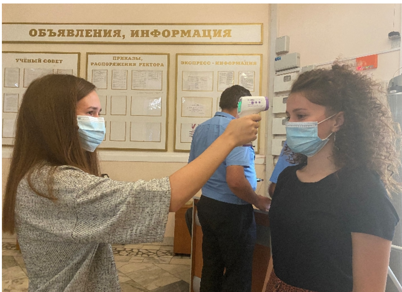
Фото 1. Организация «входного фильтра» всех лиц, входящих в организацию, с обязательным проведением термометрии бесконтактным способом.

Роспотребнадзор также рекомендует пересмотреть учебное расписание и время перерывов, чтобы максимально разобщить разные группы студентов [11]. По возможности рекомендуется закрепить за каждой учебной группой одно помещение. В коридорах, холлах и при входе в аудитории следует не допускать скопления студентов и следить за соблюдением социального дистанцирования. Массовые мероприятия разных групп обучающихся запрещаются.