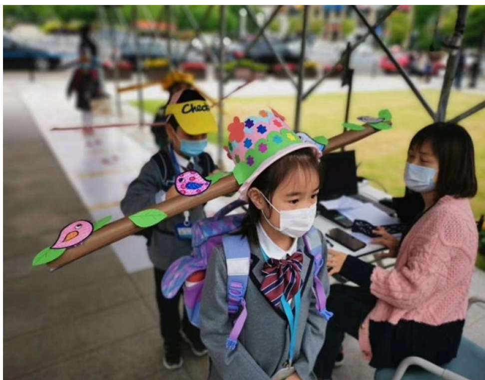
4. Варианты головных уборов для сохранения дистанции.

Дети входят в класс по одному (фото 5), перед этим у каждого измеряют температуру и дают антисептики для рук.