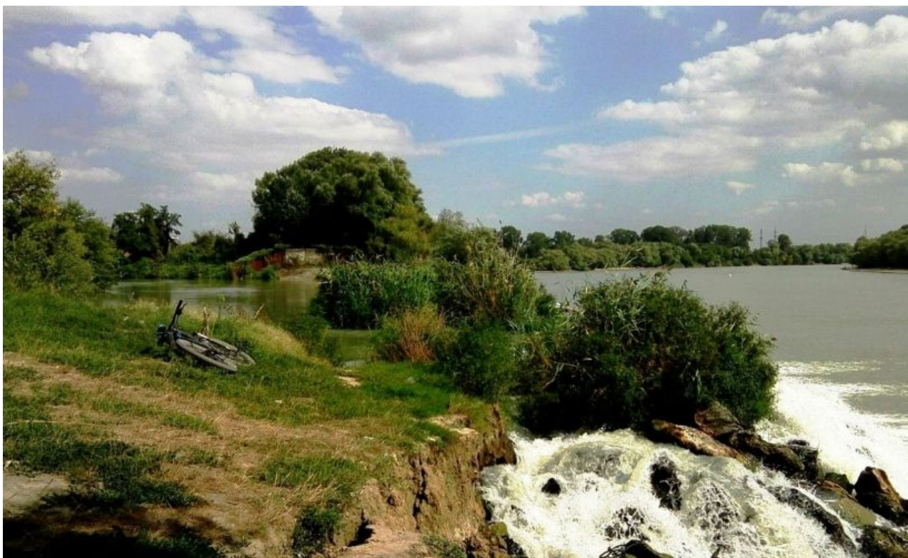
Фото 1. Парк «Солнечный остров»

Маршрут 1. Водопад за парком «Солнечный остров».