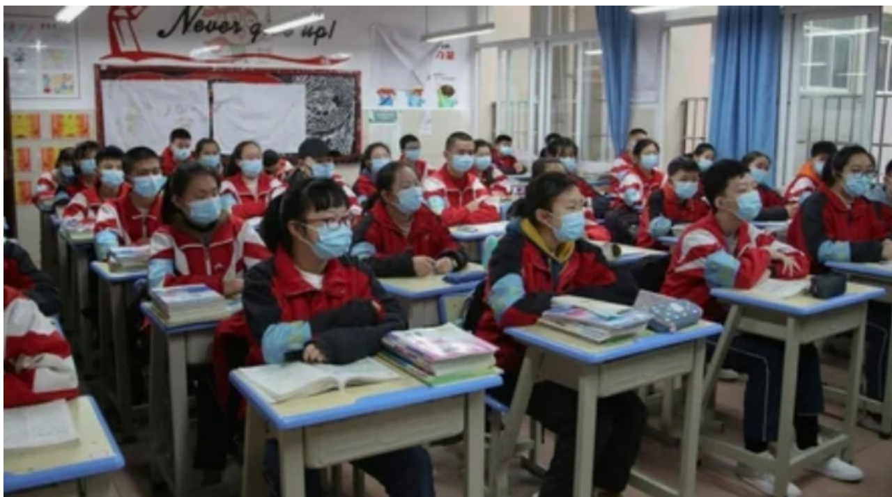
1. Занятия в китайской школе после карантина.

безопасности остаются прежними: посещение учебных заведений без медицинской маски на лице строго воспрещается (фото 1).