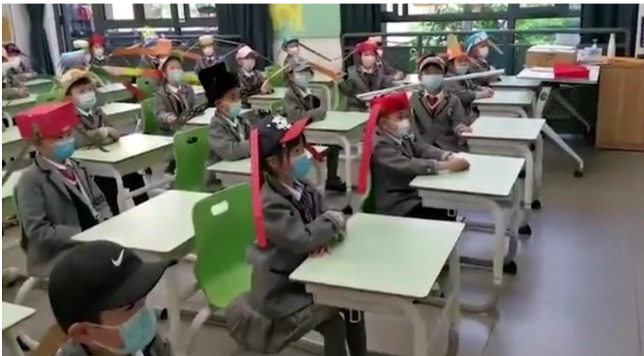
2. Китайская специфика социального дистанцирования по принципу «близко-далеко».

проще понять, что они приблизились к другому человеку на опасное расстояние (фото 2, 3, 4).