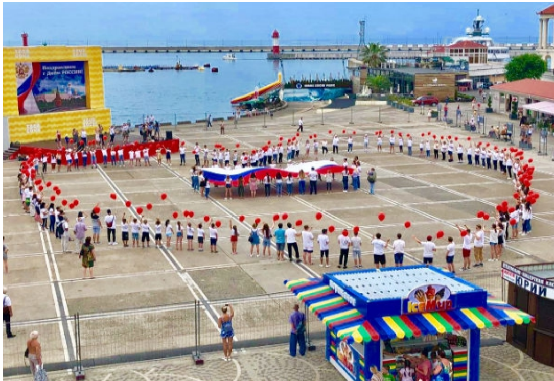
Фото 7. Флешмоб «Мы любим Россию!».