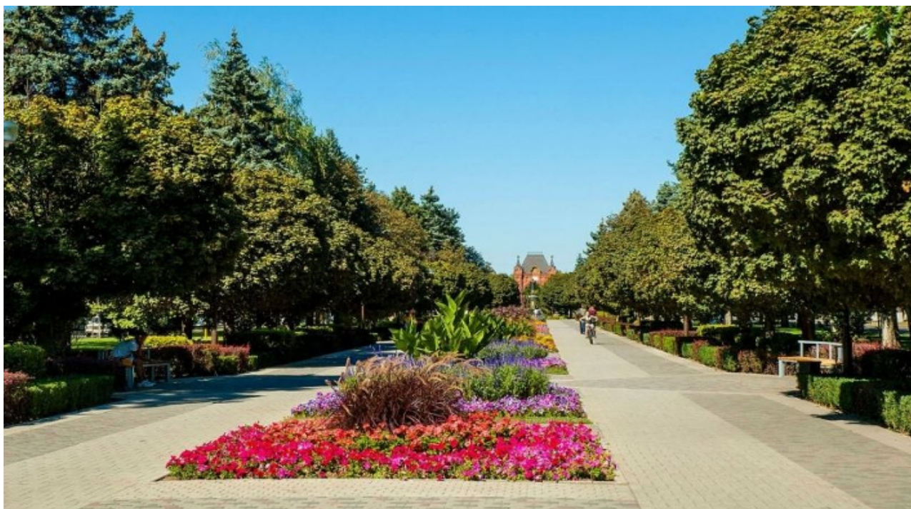
Фото 5. Велотрип по ул. Красной с цветочной аллей.