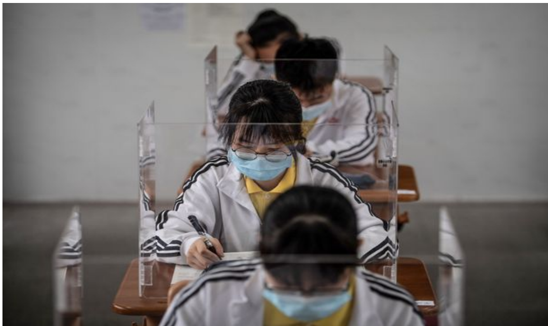
7. Защитные маски и экраны.

В некоторых школах КНР на партах установили защитные экраны из прозрачного пластика, чтобы снизить вероятность заражения.