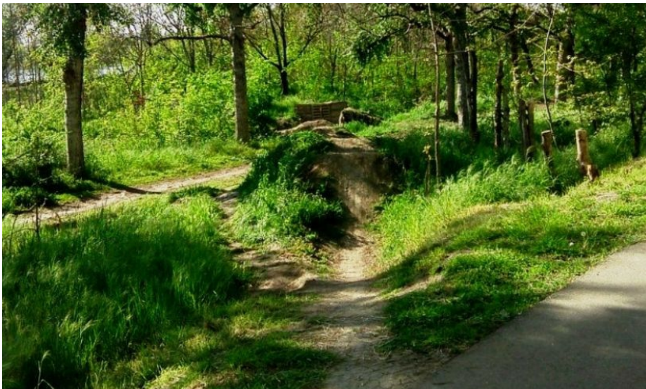
Фото 2. Тропа здоровья и дёрты в парке Победы.

Маршрут 2. Тропа здоровья и дёрты в парке Победы.