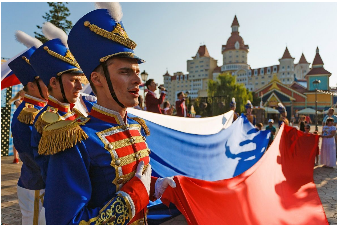
Фото 2. Участники праздника исполняют гимн России.

На праздновании Дня России в Сочи доминировали государственные символы: флаг и герб Российской Федерации, герб города Сочи и Краснодарского края, исполнение гимна России (фото 2, 3, 4).