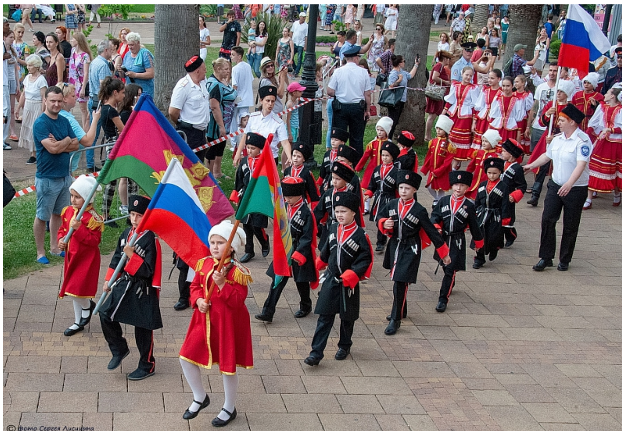
Фото 6. Парад дружбы народов в Сочи.

Население г. Сочи: 443 562 человек (2020 г.).