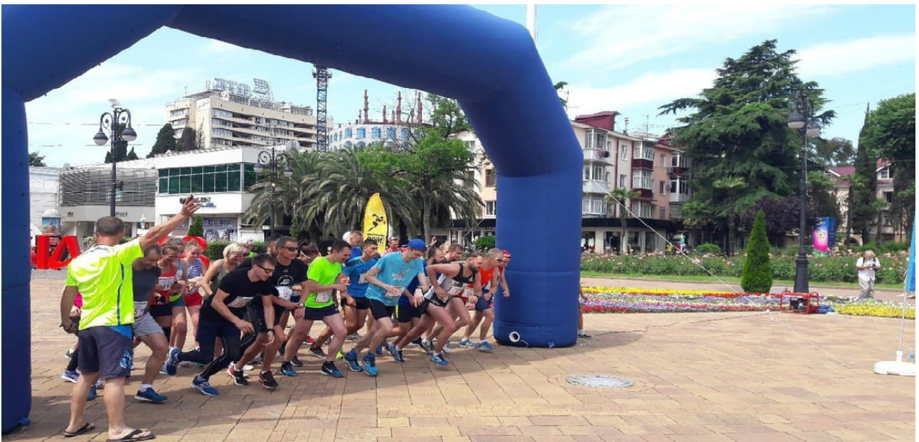
Фото 8. Сочинская миля.