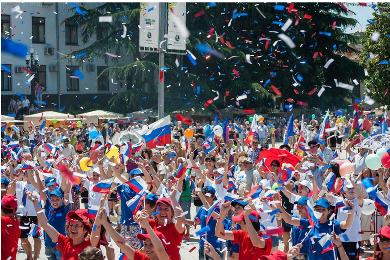
Фото 5. Молодая Россия.

Государственные символы подчеркивают гражданственность и патриотичность не только на подсознательном уровне, но и в действительности [4].