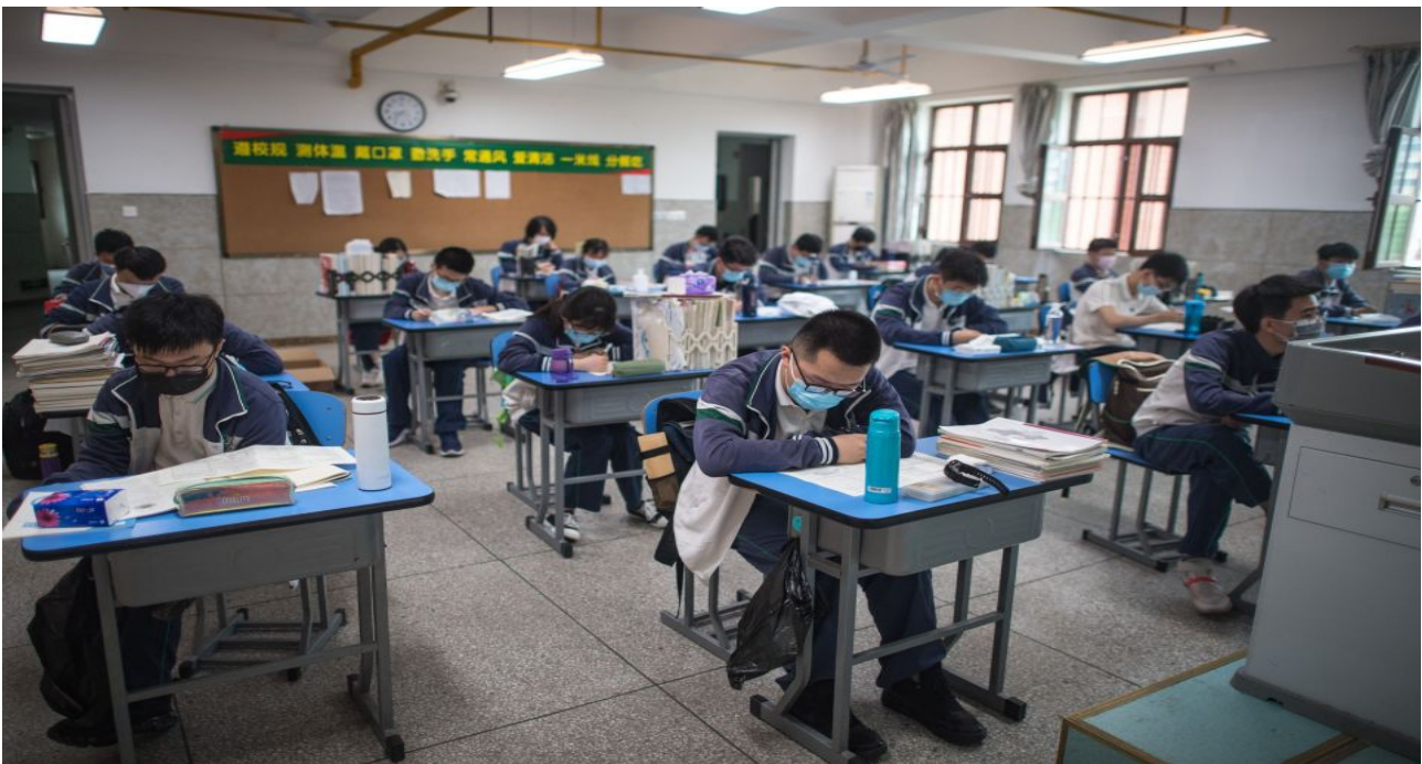
6. Дистанцирование в классе.