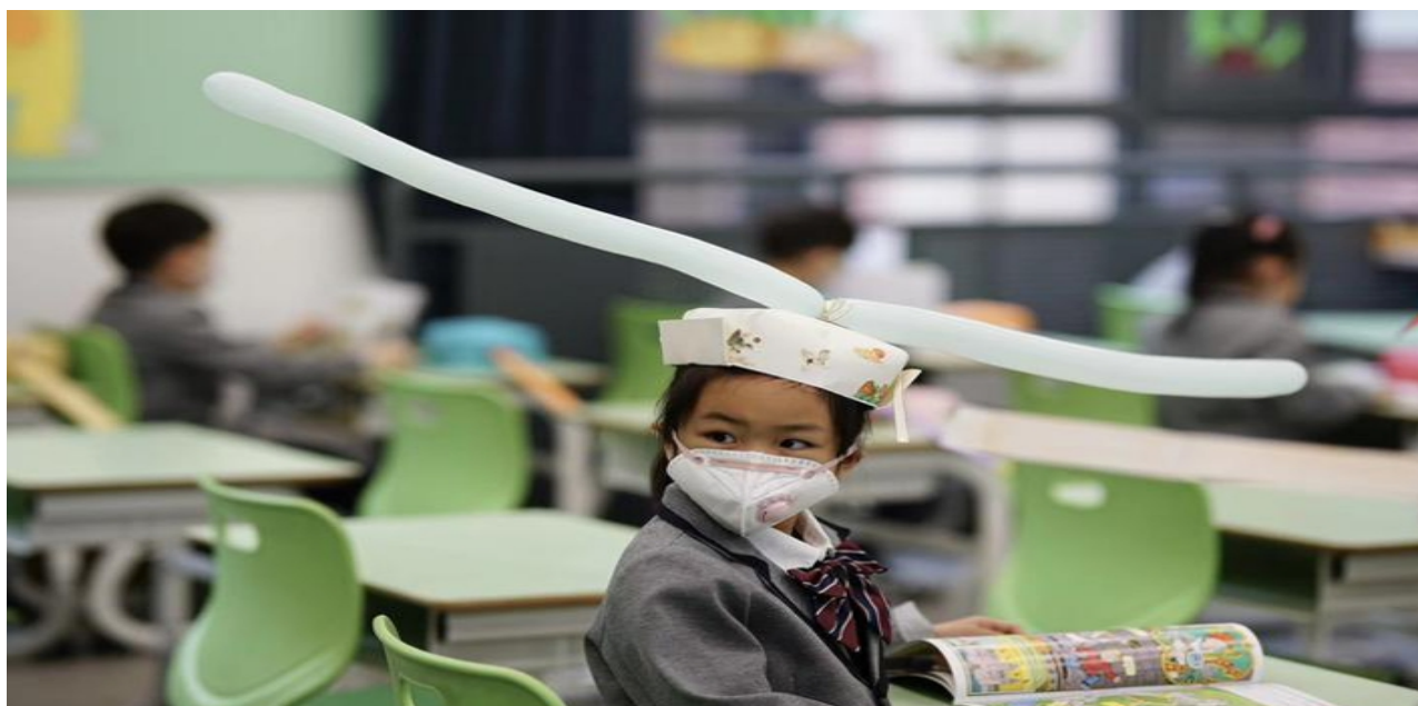
3. Головные уборы для сохранения дистанции.