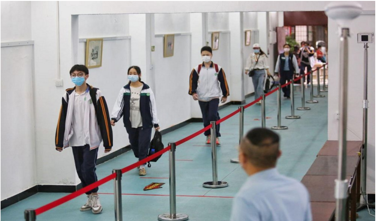
5. Социальная дистанция – 1,5 м.