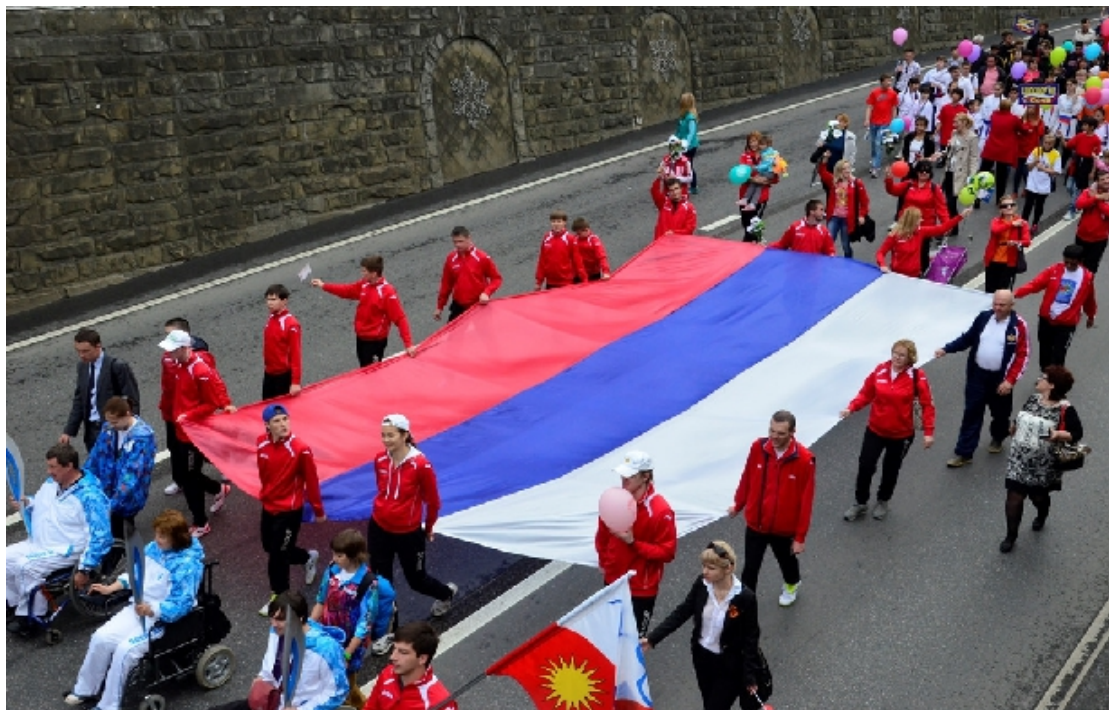
Фото 3, 4. Государственные флаги РФ на улицах города.